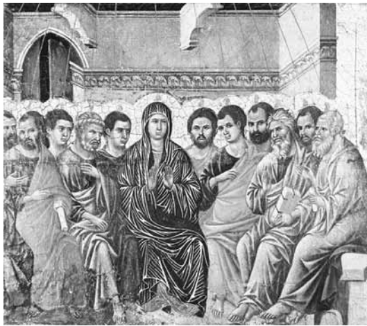
Duccio di Buoninsegna: Pünkösöd

Tizenhat nemzetiség érti a maga nyelvén Isten szavát Jeruzsálemben. A bábéli zűrzavart Isten Lelke egyetlen hanggá, akarattá egyesíti. Még mielőtt azt olvasnánk, hogy megjelennek előttük