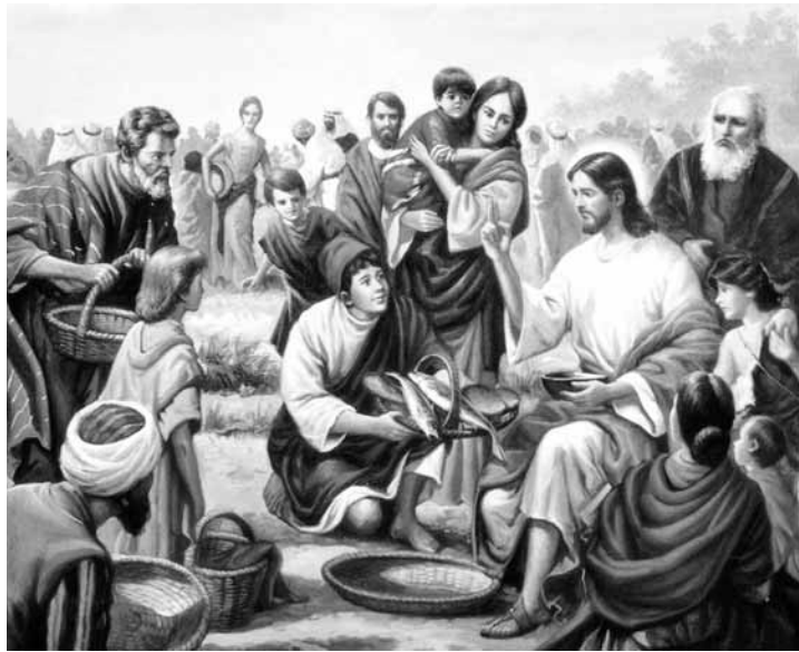
Jézus a kenyeret szétosztja a szűkséget szenvedőknek

Az egyházzal szóló egyik legfontosabb ige az ApCsel 2,42: foglalatosság voltak az apostolok tudományában, a közösségben, a kenyér megtörésében és a könyörgésben. Ebben az igében összefoglalva ott van, hogy mi az egyház, mit tesz, mit sugározhat ki e világba. Az egyház állandóan épül. Ezt a munkát nem mi végezzük, hanem Jézus Krisztus, minket legfeljebb felhasznál e munkában. Ezt Ő Igéje és Szentlelke által végzi. Gondoskodik arról, hogy e világban legyenek olyanok, akik neki szolgálnak. Ezért mi jó reménységgel lehetünk az egyház felől, s hihetjük, hogy van jövője. Mert az egyház nem emberek műve, hanem Jézus Krisztus munkája. A Szentlélek gyűjti össze a gyülekezetet, világosítja meg az ígéhirdető értelmét, ragadja meg az emberek lelkét, és kötelezi el őket, hogy Krisztus tanítványaiként hálából szolgáljanak a gyülekezetben. Ő épít be minket is élő köveként országának dicsőséges épületébe.