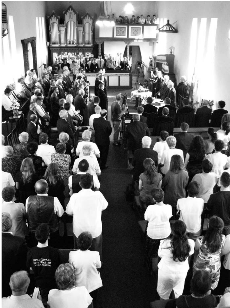
Az egyházkerületi közgyűlés első napján a közgyűlési tagok ünnepi istentiszteleten vettek részt a szovátai templomban

Mára komoly ellentét alakult ki az alapítványi, egyesületi, szövetségi keresztyénség és a református egyházi közösségek között. Lassan az a veszély fenyeget, hogy a történelmi egyház minden értéke átmegy az alapítványi-egyesületi keresztyénségbe, az egyház maga egy keret marad csupán. Pedig Krisztus az egyházat bízta meg a missziói parancs teljesítésével. A kérdés az, hogy miként lehet az egyház szent megbízatását korszerűen teljesíteni? Lehet-e még az egyház az a hely, ahol