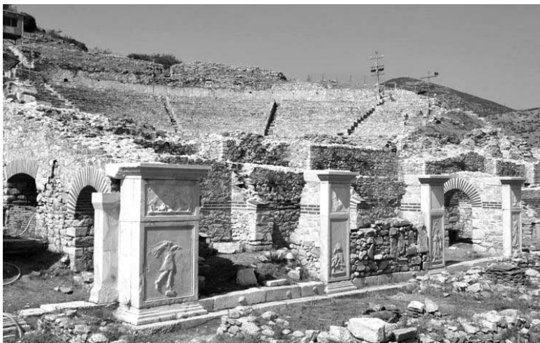
A római téátrum maradványai az ókori Filippiben

Istentiszteleti imáinknak fontos része, amikor azért imádkozunk, hogy az Úr nyissa meg a hallgatók szívét. Ha ez megtörténik, akkor ez a Szentlélek munkája. Hála Istennek, ez ma is megtörténik, ahogy Lídiával, az első európai keresztyén asszonnyal. Bár ő gazdag üzletasszony volt, a pénz mégsem töltötte ki életét, ezért szombatontként jelen volt az összejöveteleken, s bár pogány származású volt, kezdte keresni az igaz Istent, akit meg is talált a Krisztusban.