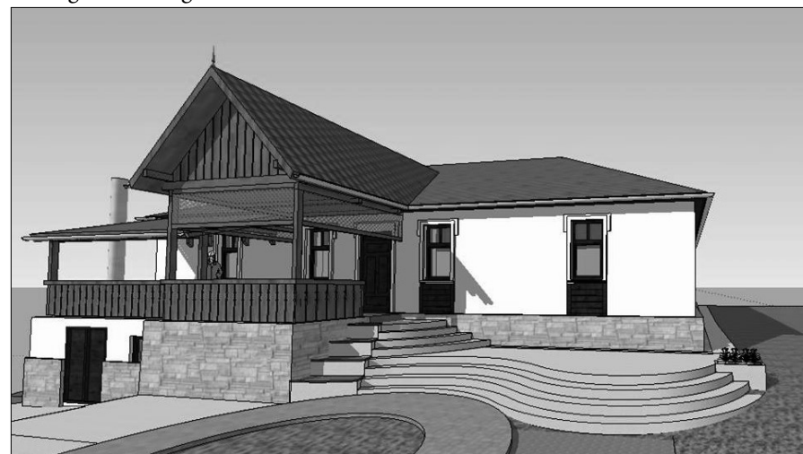
Az egyházközség közgyűlése elfogadta a parókia felújításának tervét. Isten segítségével két év múlva így fog kinézni a parókia.