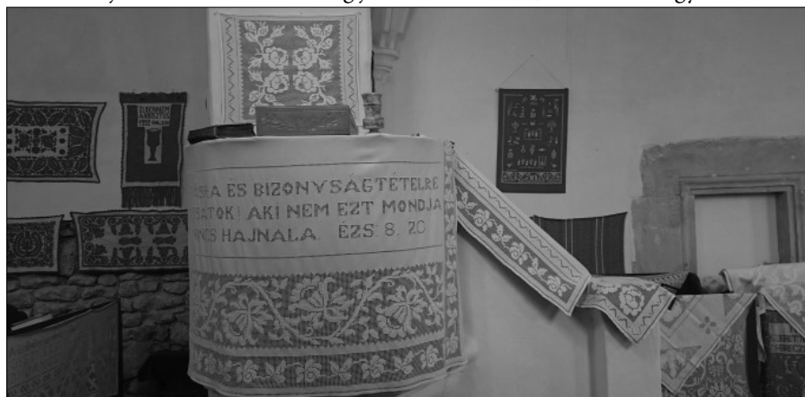
Az új szószéktakaró a Nőszövetség közös erőfeszítése nyomán készült.

Hunyadon volt az a szokás Szent György napkor. De húsvétkor kölnivel jöttek oda is a locsolók, vízzel nem nagyon.