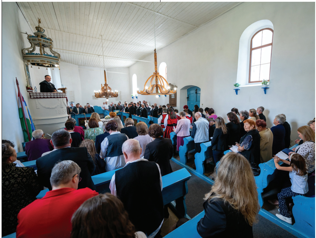
Ünnepi istentiszteleten az aldobolyi templomban az új orgona felavatása alkalmával

a templomba járók száma. Nyáron a létszám kicsit megcsappan, iskolakezdéssel, majd ősz végén az ünnepek közeledtével ismét megnő.