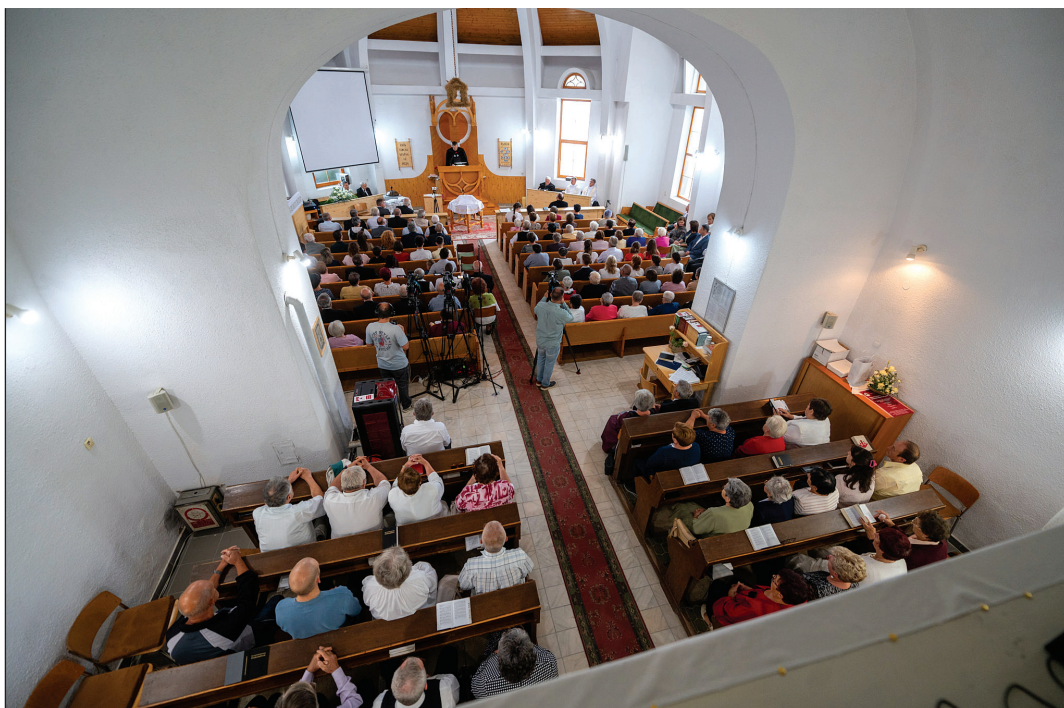
Az ígének ma is ereje van – hangzott el a gyergyószentmiklósi református templom 125 éves évfordulóján

Itt a reformáció napját méltóképpen megünnepelni is ismétlődő kihívást jelent, hiszen a családok jelentős része felekezeti megosztott, és a többség, amely nem ezen a vidéken született, ilyenkor felkeresi hozzátartozói sírját, és nem szeretné elszalasztani a találkozási lehetőséget az élő rokonokkal. | 3.