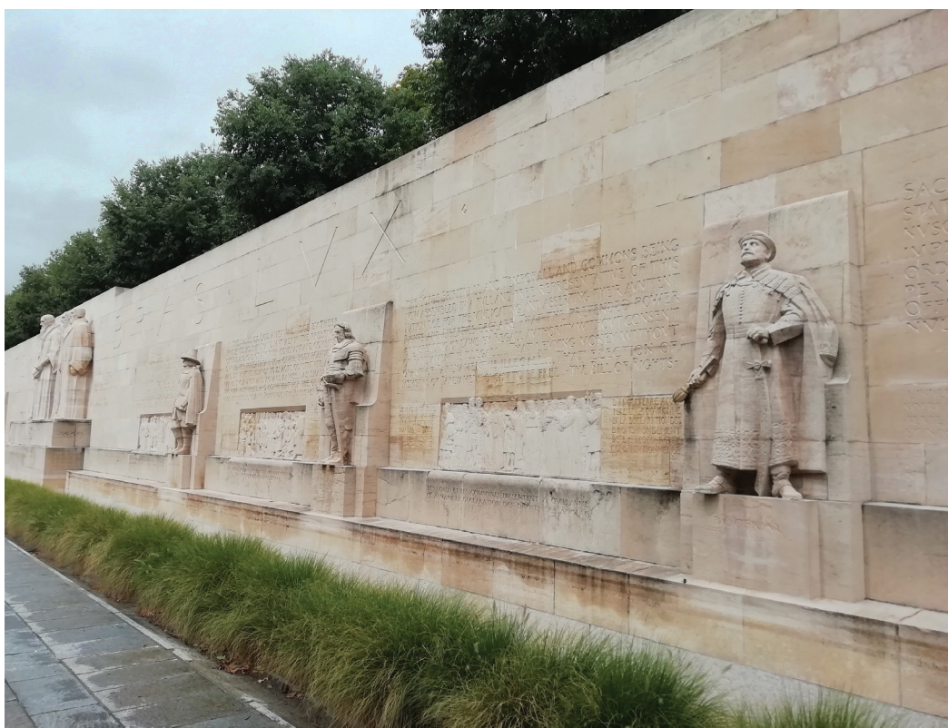
A reformáció genfi emlékműve. A kőszobrok közül az egyik Bocskai Istvánt (a képen jobbról az első) ábrázolja

Kiviláglik a tanulság: a reformáció páratlan eseménye mennyből vezérelt hatalmas isteni tett volt. Amikor az előreformátorok, reformátorok egyszerre jelentek meg Európában egymástól függetlenül, de Isten ígéje, Lelke intésére. Minden nemzetben szinte egyszerre. Egyre tisztábban látom, hogy Atyánknak mennyire nem volt kedvére az egyház akkori elesettsége, s milyen tette kész szájalmat érezhetett kontinensünk népei iránt, amelyek hatalmas lelki sötétségben vesztegeltek. Sem ige, sem kijelentés nyelvükön, sem istenismeret, keresztyénségük is babilóniai babonás fogságban – ahogyan Luther kifejezte könyvecskéjében. Ezt 1517. október 31-én a wittenbergi vártemplomra kiszögezett 95 tétele után három évvel írta. Az egyház babiloni fogságáról úgy írt, mint Isten újszövetségi népének megkötözöttségéről, az egyházi visszaélések okozta európai színvo-