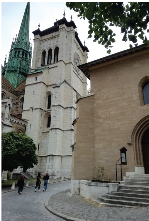
Kálvin auditórium. Háttérben a genfi székesegyház

Lépésenként, tagolva mondom a szavakat: Post tenebras lux – sötétség után fény. És „maga Isten sem tudhatta másképp”. Mert nem is akarta – mindenkiért, a jövővért.