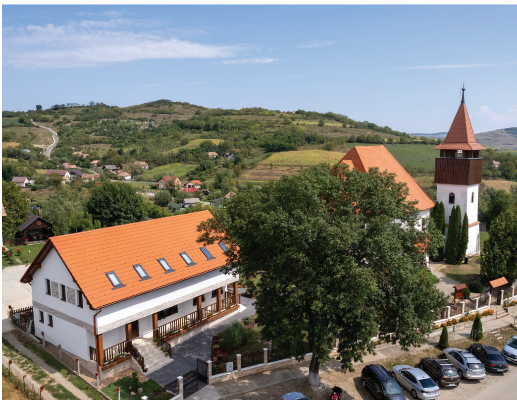
A búzai templom mellett látható új gyülekezeti otthon felépítését a magyar kormány támogatta

– A vasárnapi istentiszteletre 60–80 személy szokott eljárni, nők és férfiak fele-fele arányban, de az sem ritka, amikor a férfiak vannak többen. A heti istentiszteletek mellett vallásórákat, első- és másodéves konfirmációi előkészítőt tartunk. Míg régebb 6–8 konfirmándus volt, az elmúlt években csupán 2–3 fiatal. A bibliaórát is igyekszünk megtartani, ősszel és szilveszter után is hirdetjük, de a hívek nem mindig jönnek nagy számban. A településen található egy idősothton. Sátoros ünnepek alkalmával a gyülekezeti tagokkal (20–30-an) meglátogatjuk az időseket, zoltárokat énekelünk, a reformátusoknak úrvacsorát osztunk. Az egyházmegyében rendezett nőszövetségi, presbiterszövetségi, ifjúsági és más egyházi rendezvényekre mindig elmegyünk. Azok a fiatalok, akiket nyolc évvel ezelőtt a gyülekezetben találtam, már rég „kirepültek”, megházasodtak, elköltöztek. Az új nemzedékek a virtuális világban élnek, ebből nehéz őket kimozdítani. A vakációs bibliahetet immár harmadik éve a szomszédos gyülekezet fiataljaival együtt tartjuk (Melegföldvár, Katona, Feketelak, Mezőveresegyháza, Kékes). Reméljük, az együttlét a gyerekekben erősíti a közösségi szellemet, a református magyar öntudatot. Innen jött az ötlet, hogy a nyáron felépült új gyülekezeti otthonba különböző eseményekre hívjuk meg a környező kisebb települések magyar reformátusait is. Azért, hogy egymás hite által is épüljünk.