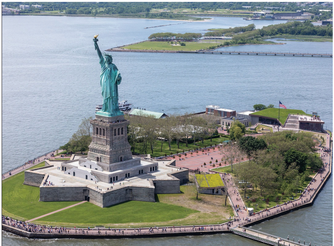
A Szabadság-szobor a 21. században is hirdeti a békeakarat minden néphez szóló egyetemes érvényességét

Bartholdi terveinek kivitelezésében támogatta őt az az isteni akarat, amelynek áldását kérte erőfeszítéseire. A tőle kapott belső ihlet tette őt tántoríthatatlanná. Édouard René Lefebvre de Laboulaye (1811–1883) republikánus politikus, az Egyesült Államok háromkötekes történetének szerzője azt tűzte ki célul, hogy az amerikai függetlenségi nyilatkozat századik évfordulója alkalmából 1876. július 4-én nagy-szabású emlékművet állíttat. Az általa alapított Francia–Amerikai Unió tagjai olyan óriási szobrot képzeltek el, amely minden korábbit felülmúl. Ettől kezdve Bartholdi szilárd elképzelése volt a szobor felállítása, és még a Franciaország által 1870. július 19-én Poroszországnak meghirdetett háború és egyéb akadályok (pl. pénzhány) sem tántorították el céljától. 1875-