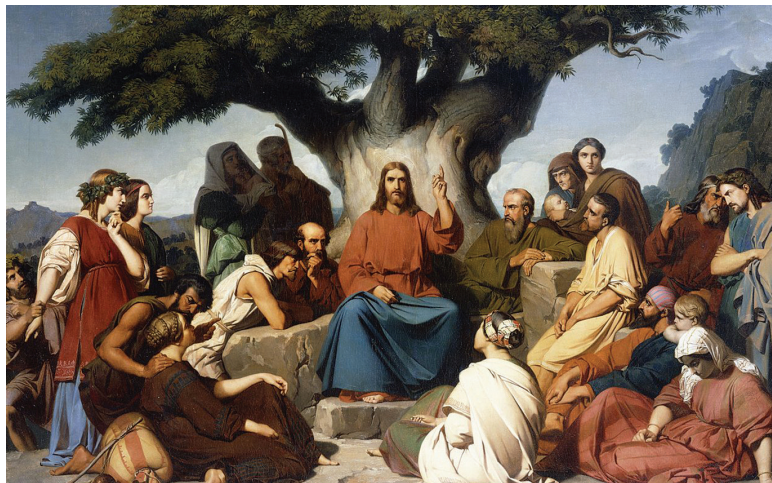
Jézus a hegyen prédikál (Edouard Louis Dubufé festménye)

Jézus parancsainak sokféleségéből álljon itt még néhány megszívlelendő ige a Hegyi Beszédből: „Legyen bennetek só! Legyetek okosak, mint a kígyó és szelídek, mint a galambok! Imádkozzatok azokért, akik hábor-