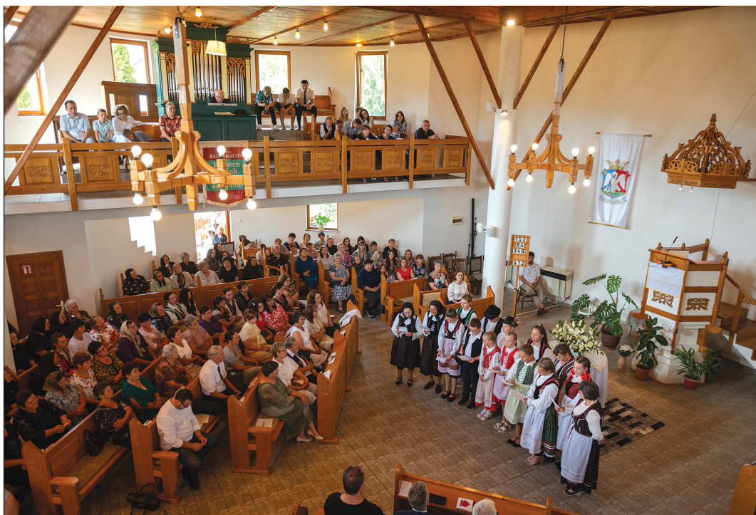
Ünnepi hangulat a búzai templomban az új gyülekezeti ház felavatása alkalmával tartott istentiszteleten