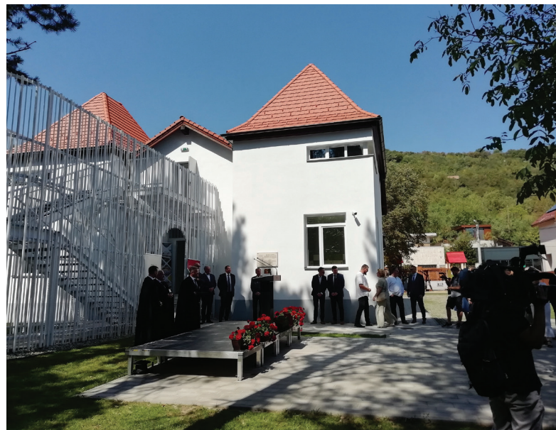
Az óvoda a törökvágási templomhoz van közel, de a református kollégiumhoz tartozik

Az ötlet különben tíz évvel ezelőtt, a Kolozsvári Magyar Napok (KMN) alkalmával született meg, amikor a református egyház Istennek adott hálaát a református kollégium felújítása alkalmából. „Akkor azt mondtam, jó lenne, ha a KMN keretében a református egyház minden évben valamit átadhatna, felújítana a kolozsvári magyar közösség számára” – mondta a megnyitón Kató Béla püspök. Idén a kollégium új bölcsődéjét adták át, amelyre a városban nagy szükség van. Tasnádi István iskolalelkész szerint rengeteg fiatal család keresi a jó minőségű óvodát, bölcsődét, az állami helyek száma a magyarok számára ugyanis rendkívül korlátozott. A kollégium óvodájában négy csoport működik, az idén őszre meghirde-