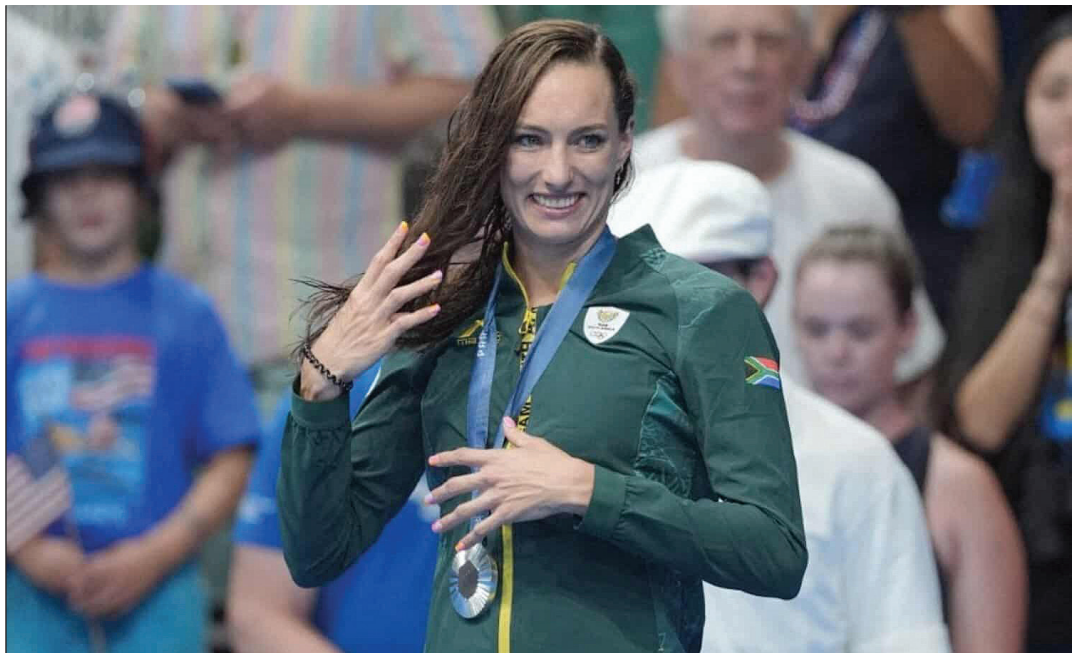
Tatjana Smith: „Isten dicsőségére úszhattam, és közben képviselhettem hazámat, Dél-Afrikát”

A legnagyobb nemzetközi, keresztyén és független médiumok az első naptól fogva jegyezték a sportolók szavait, vallomásait. Az olimpiai faluban 124 hivatásos személy tevékenykedett, akik egy-egy vallás vagy keresztyén felekezet képviselői, papjai, imámjai, rabbijai. Ez is hozzátartozott a párizsi olimpiai összképhez!