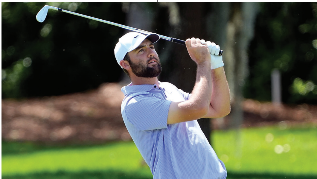
Az olimpiai aranyérmes Scottie Scheffler golfozót szülei tanították meg az imára és a bibliaolvasásra

Az afrikai női atlétában és a fent idézett többi olimpikonban is szinte szó szerint visszaköszön Pál keresztyén versenyszelleme 2024-ben. Isten dicsőségére.