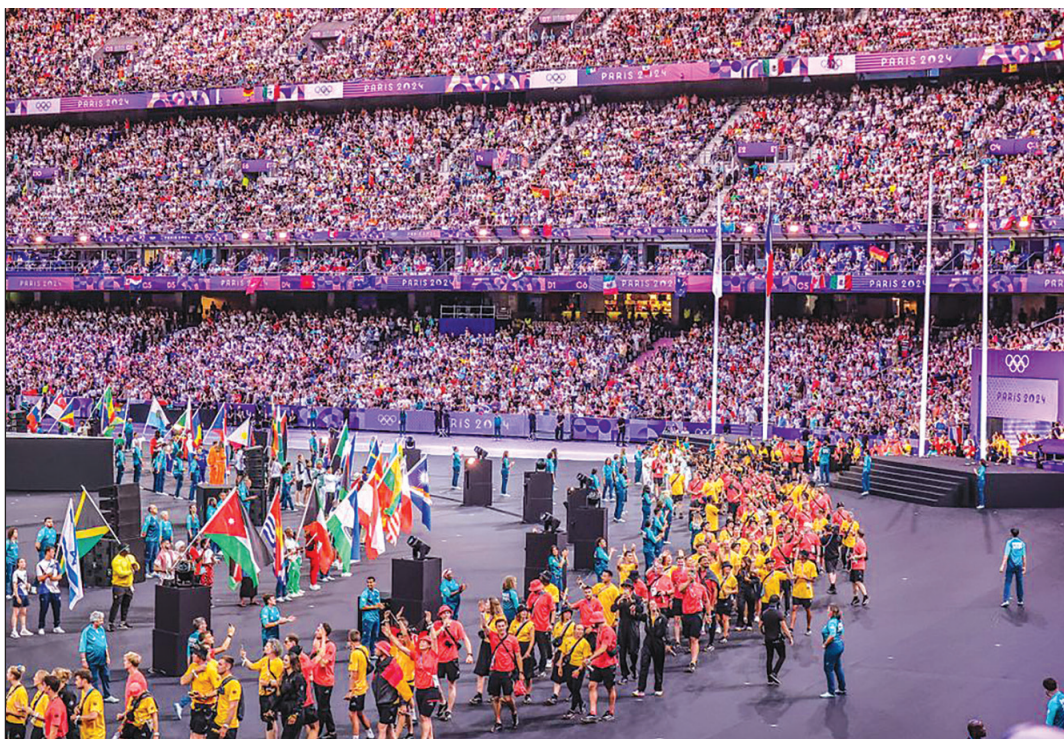
A záróünnepségből állítólag kivették azokat a jeleneteket, amelyek ismét felháborodást okoztak volna