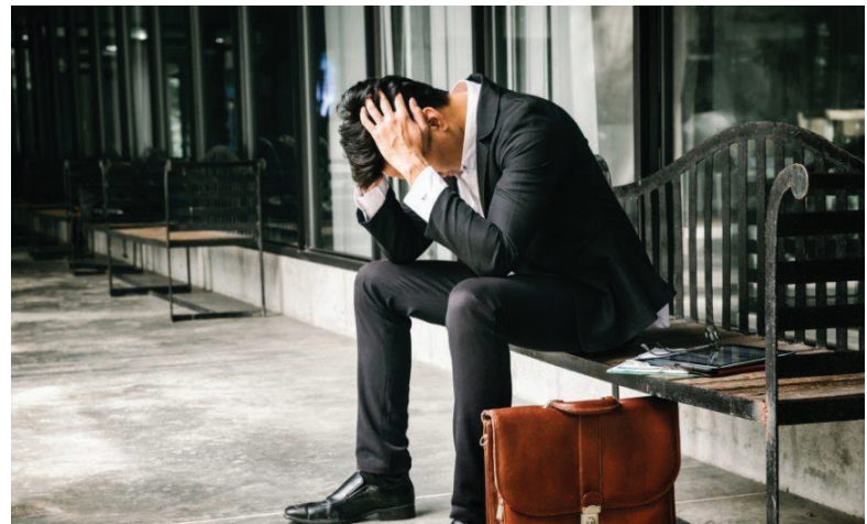
Hamar elcsüggedünk. A kudarcot pedig sokszor képtelenek vagyunk elviselni

Igen, világunk tönkrement. Megpróbáltatásunk és nyomorúságunk elviselése gyakran soknak tűnik. Földi életünk csupán egy szempillantás, ha összehasonlítjuk az örökkévalósággal. Mindeközben sóhajtozásaink