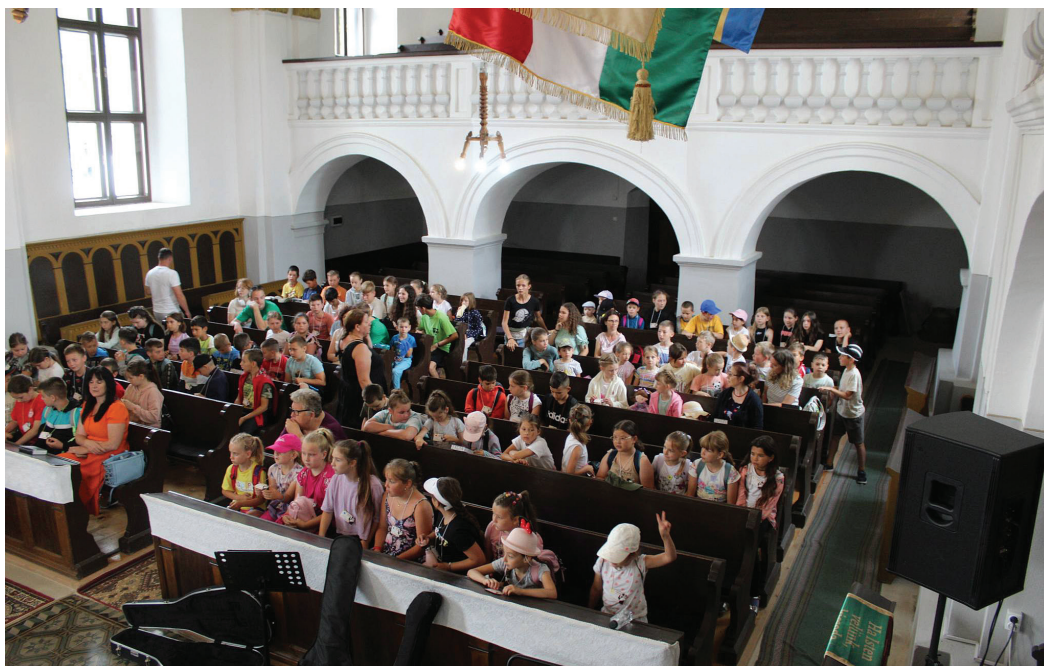
Az egyházmegye vallásórás gyerekei több mint 260-an gyűltek össze a zágoni templomba

Csütörtökön az egyházmegye presbiterei gyűltek össze a székhelytamásfalvi templomban, ahol Visky Béla teológiai tanár tartott előadást Erőforrásra lelni a csüggesztő élethelyzetekben címmel. Az előadó a csüggedésből kivezető utakra hívta fel a hallgatóság figyelmét saját élete példájával szemlélítve. Kiemelte, Isten az, akinek a segítségével a reménytelen élethelyzetekből is kiemelkedhetünk. Az egyház nem egy szolgáltatás, amitől mindig csak várunk és elvárunk valamit, hanem érték, amihez