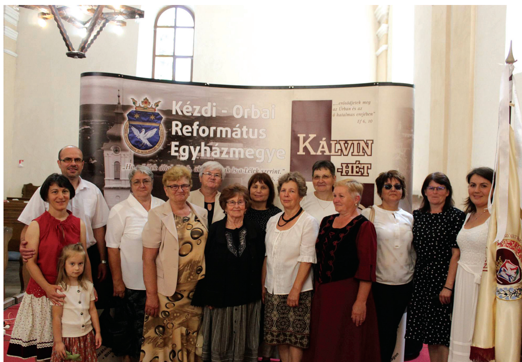
Alsócsernátonban hangulatos nőszövetségi napon vettek részt a több mint 30 gyülekezetből érkező asszonyok