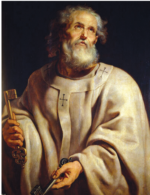
Minden gondotokat reá vessétek – mondja Péter apostol (P. Rubens flamand művész festménye)

Létezik Isten által munkált szomorúság, amely bűnbánatra indítja az embert. Egy középkori bölcselő szerint „a gondolkodásunkat kell megváltoztatnunk ahhoz, hogy minden megváltozzon.” Valóban, meg kell változnunk értelmünk megújulásával, hogy ha életünkön