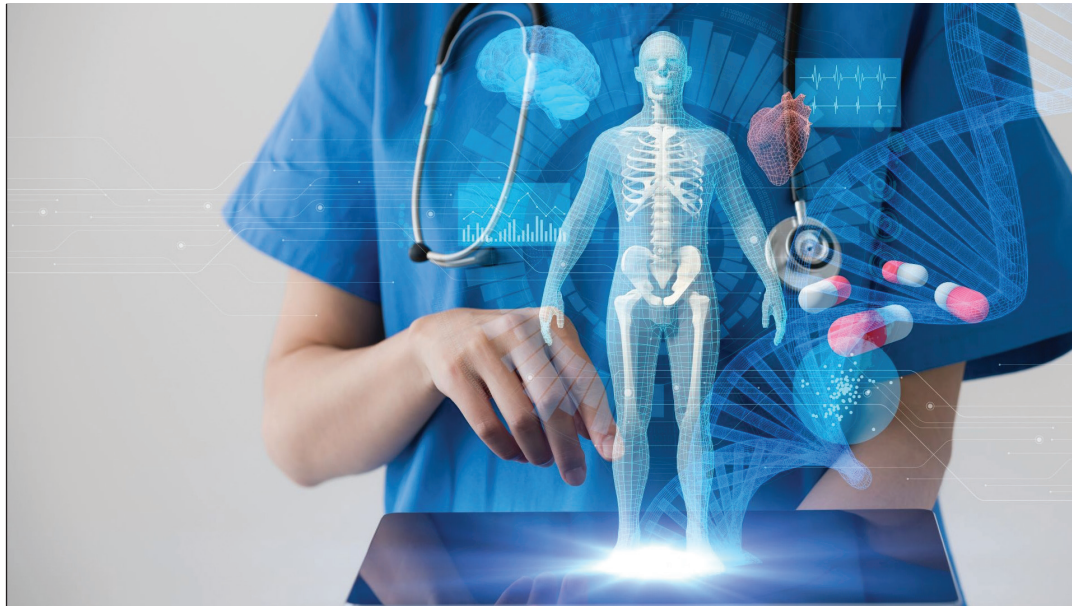
Ne csak a rosszat lássuk. Az MI-t a reumatológiában és autoimmun kórképekben haszonnal tudják alkalmazni

Ez és más hasonló törekvések – hogy a hagyományos vallásokat, hiteket technicista istenségekkel váltsák le – komoly kihívást jelentenek a keresztyénség számára. Miközben a bibliai világlátás realitásait a technika és az emberi szellem bálványaival próbálják kiiktatni, csak emlékeztetni szeretnék arra, hogy voltak-vannak gondolkodók, akik bibliai indíttatással szólaltak meg. Köztük Peter Berger osztrák vallásszociológus az 1990-es években, a hol-