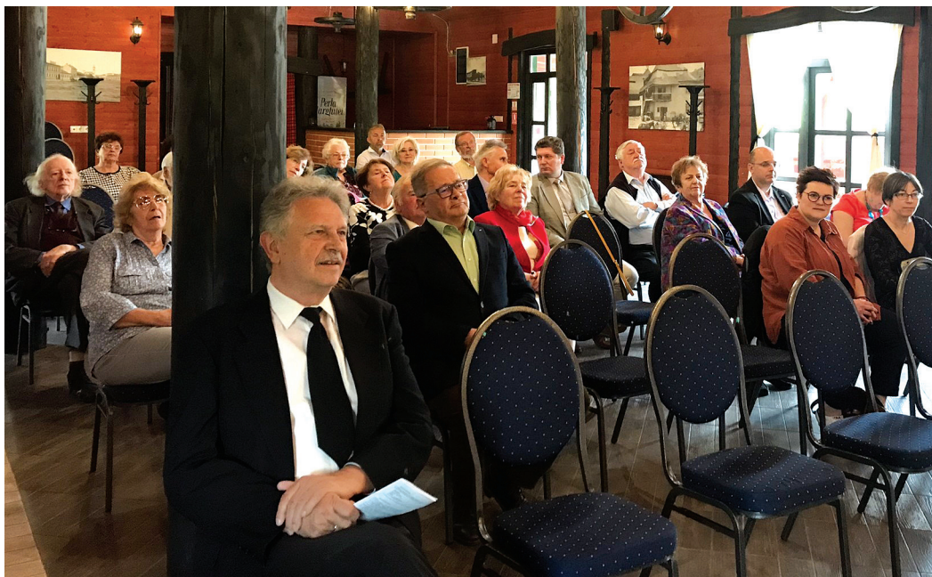
A konferencián az elvándorlással kapcsolatos helyzetet, okait és az itthonmaradás lehetőségét vizsgálták

Működése első két évtizedében könyvkiadást is felvállalt, főleg a külföldre került magyar írók műveit terjesztette. 1989 után a Kárpát-medencében alakított testvérszervezeteket, és gyakran itt rendezte éves találkozóit is, amelyeken egy-egy konkrét téma megvitatására került sor.