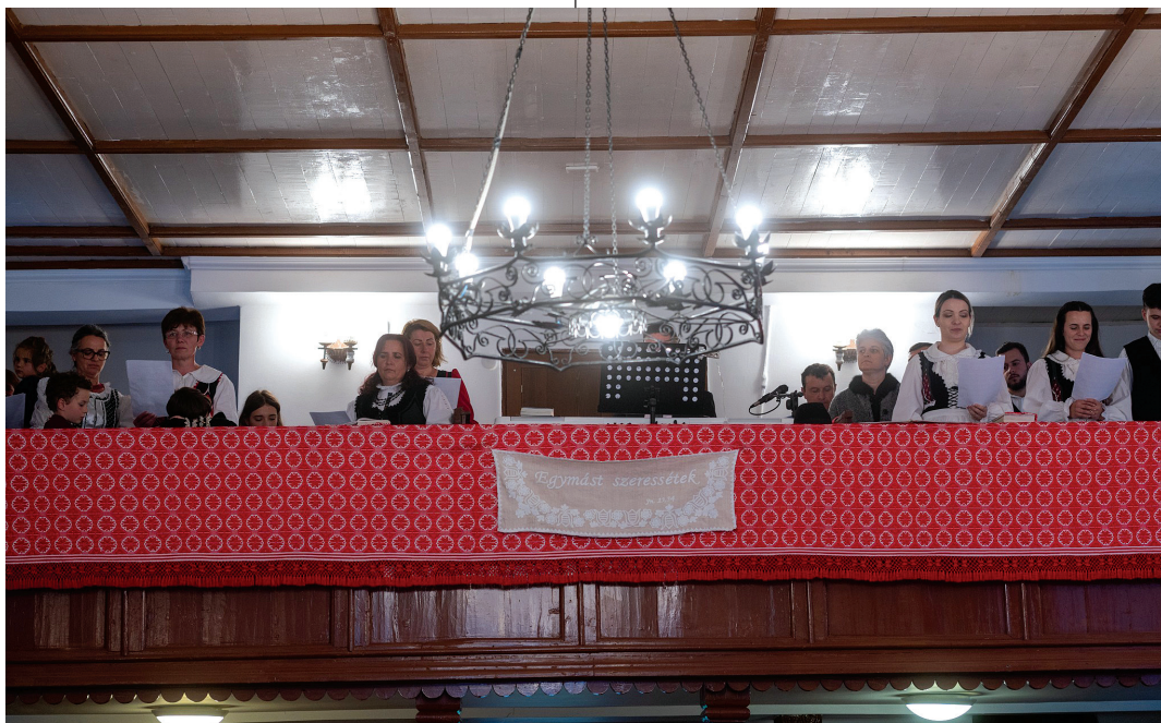
A Magyarszováton tartott püspöki vizitáció alkalmával a templomban ünnepi istentiszteletre került sor

– A 300 lelkes gyülekezet ideális, mert átfogó képet tudok kapni a közösségről. A hívek megnyílnak, közvetlenek, bekapogtatnak a lelkési lakásba, s elmondják, milyen gondjuk van, mit szeretnének megbeszélni. Ez a hozzáállás még a vidéki gyülekezetekre sem mind jellemző. Egy fiókos dobozt állítottunk fel a templom portikusában három témával. Az egyik ilyen a szolgálatokban való segítség: az emberek papírra ráírhatják, miről szeretnének igehirdetést hallani. A másik a családlátogatásról szól: megírhatják, hogy a szokásos évi családlátogatáson kívül kik várják látogatóba a lelkipásztort. A harmadik fiók az imatéma. Ide olyan jellegű cetlik kerülnek, amelyekre névtelenül azt írják az igénylők, hogy szeretnék, ha istentiszteleten egy adott családban élő megkötözött, alkoholizmusban vagy más betegségben szenvedő személyért imádkoznánk. Egy imahéten állítottuk fel a dobozt, és visszajelzés, a szolgálatom során sokat segít.