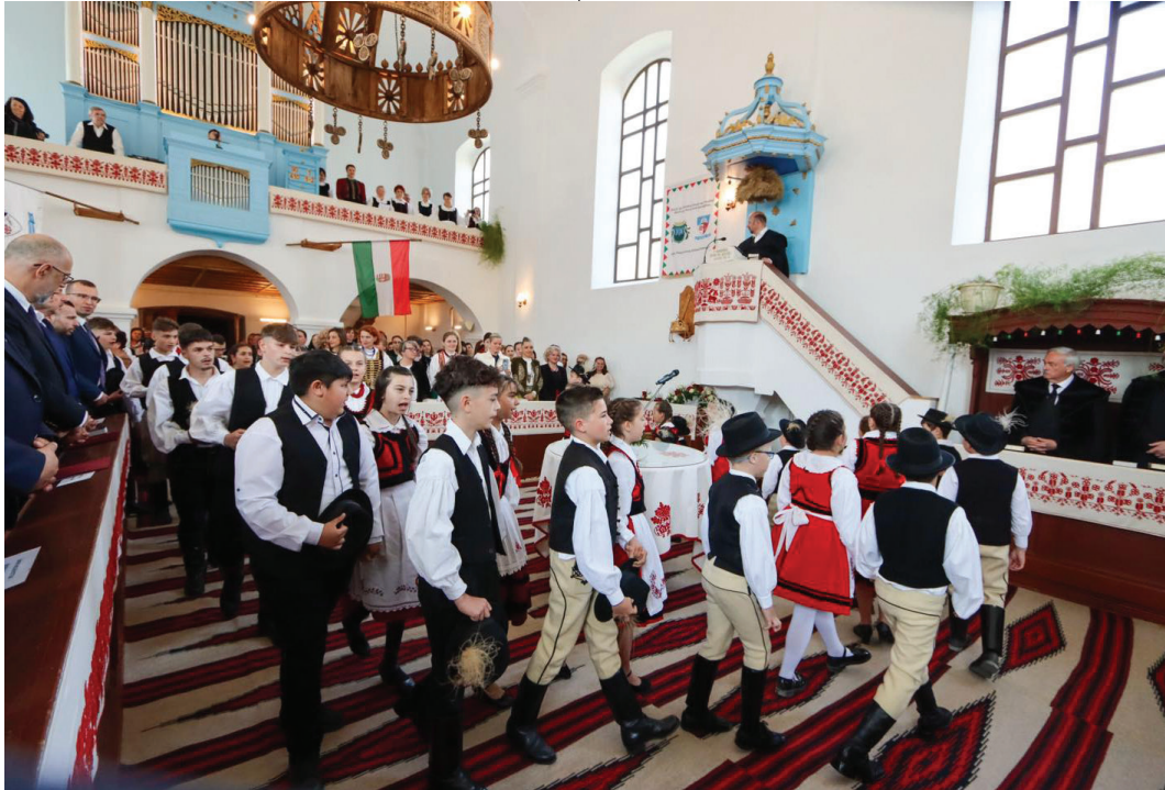
Népviselőbe öltözött gyermekek a székelyszentkeresztbéli templom felavatása alkalmával tartott ünnepségen

Engedjük hozzá a gyermekeket, hogy e világ sötétségében lássák az ő szeretetét, szelídségét felragyogni. Akik az ő csodálatos tulajdonságait magukévá teszik, képesek lesznek egymáshoz Jézus szerint viszonyulni. Ma, ha Isten hívását halljátok, meg ne keményítsétek szíveteke!