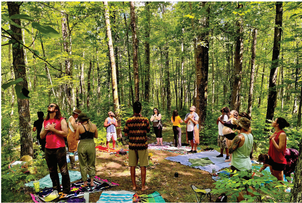
A nyugati társadalom stresszes életvitele miatt az emberek egyre kevesebbet tartózkodnak a természetben

– Az ösztönös megérzéseimre bízom magam, amikor ilyen sétát vezetek, mert egyrészt figyelembe veszem az aznapi energiáimat, másrészt a csoport résztvevőinek energiáira is tekintettel