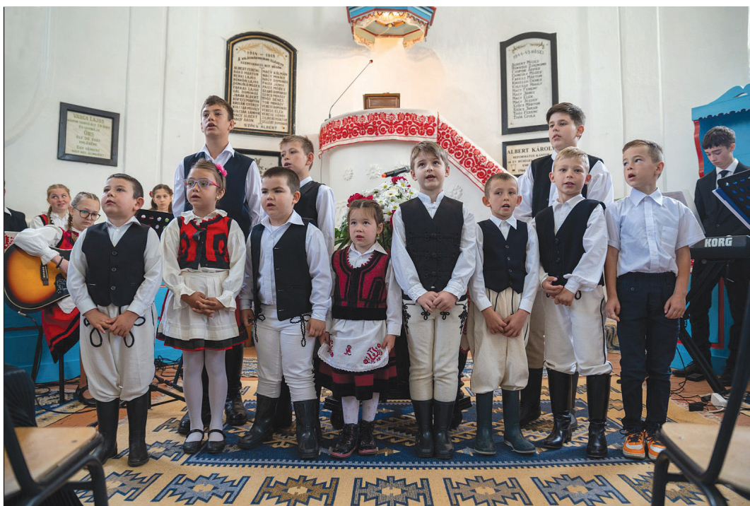
Gyermekműsor a szentgericei gyülekezeti ház felavatása alkalmával tartott ünnepi istentiszteleten

Az Úr a gyermekekkel kapcsolatban is ad nekünk utasítást, hiszen az élet folytatását a gyermekáldás ajándékozásával gondolta el a Földön. Ő a gyermeket annyira az élet velejárójává tette, hogy sokan a gyermektelenséget Isten büntetésének gondolják. Választott népének életében a sok gyermekkel való megáldás a legjobb kívánságok közé tartozott. Az elsőszülöttet az Úrnak ajánlották fel, az ő szolgálatára adták. A névadással is a gyermek Istenhez való tartozására utaltak. Azok, akik Isten ajándékában részesültek, a gyermeknevelést már az anyaiólben elkezdték, majd az apa legszentebb feladatává vált a fiúgyermek nevelése, | 3. oktatása.