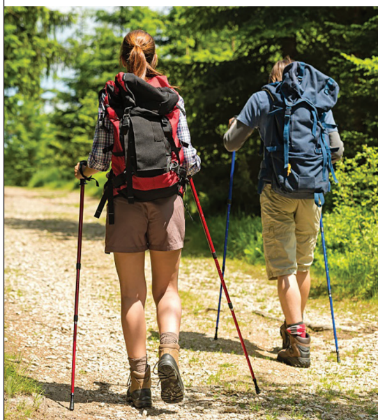
A túrabot elengedhetetlen kelléke a hegyi túrázásnak

– Mi történik, ha kifogyunk a vízből, ám nem bízunk meg egy forrásban?