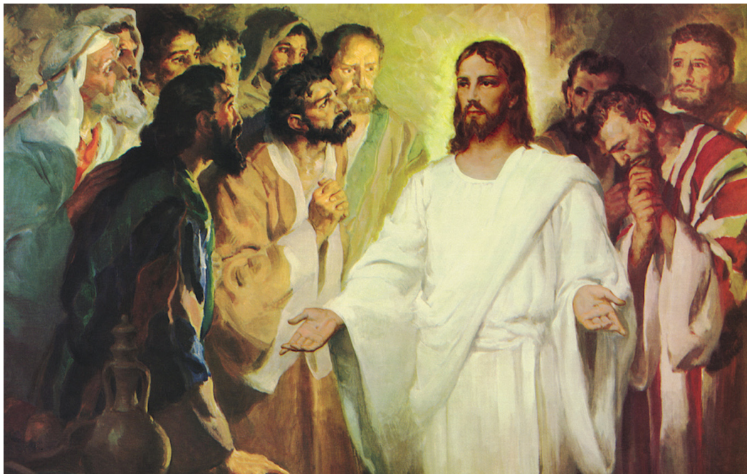
Jézus feltámadás után megjelenik a tanítványoknak, rájuk lehel, és azt mondja: vegyetek Szentlelket!

Hálások lehetünk e pünkösdön is, hogy Szentlelkével az embert „kevással tetted őt kisebb Istennél, dicsőséggel és méltósággal koronáztad meg” (Zsolt 8,6). Kevással kisebb: boldog ember az, aki e kevással kisebbet tiszteletben tartja, s nem képzeletben magát, mint aki – ember, Isten kölcsönlelkével egy életen át.