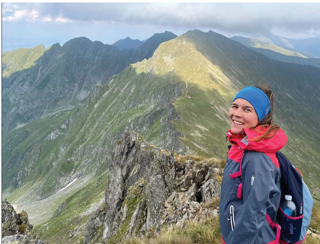
Útban a Moldoveanu felé. A Fogarasi-havasokban található 2544 m magas csúcs az ország legmagasabb pontja

Az sem mindegy, hogy télen vagy nyáron túrázunk. Léteznek különleges felszerelések, amelyek télen elengedhetetlenek. Ilyen például a réteges öltözet, mert habár télen hidegebb van, mégis könnyen ki tudunk melegedni, ilyenkor fontos, hogy valamit le tudjunk venni magunkról. Szükséges a meleg ital, tea a kihűlés ellen, egy hófogó, hogy ne menjén csiz-