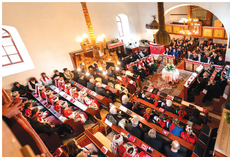
Vasárnap délelőttként mintegy 150–160 lélek vesz részt az istentiszteleten

– Az első keresztyének, amikor vasárnaponként összegyűltek, Jézus feltámadását ünnepelték: közösségben, Isten ígéjére figyelve, imádkozva, úrvacsorázva. Az együttléteik alkalmával a középpontban a feltámadott Úr állt, a vele való találkozás tette az ünnepet magasztossá. Ahogy teltek az évszázadok a minden heti feltámadás ünnepséből évi egy alkalom lett. A ma embere is megünnepli a feltámadást: több étel, ital kerül az asztalra, többen szórakozik. Minden külső körülmény adott a kellemes ünnepségre, csupán egy „csekélység” hiányzik sokszor: a feltámadott Krisztusba vetett hit. És ezzel hiányzik az ünnep szíve is. Nem véletlen, hogy egyre több ember számára jelent a húsvét – kapcsolódást. Sokan vannak, akik elfogadják Jézus földi szolgálatát, jónak tartják tanítását, és elhiszik kereszthalálát. De a feltámadást már úgy kezelik, mint az egykori tanítvány, Tamás: hiszem, ha látom. Akkor a csoda az volt, hogy Tamás számára Jézus megjelent, hogy az hitre jusson. „Boldogok, akik nem látnak, és hisznek” – mondta a Mester akkor Tamásnak, és üzeni most nekünk is. Így váljon a ma emberének ünneplése kikapcsolódásból öröndezéssé. Jussunk el a kételkedésből a boldog bizonyosságba!