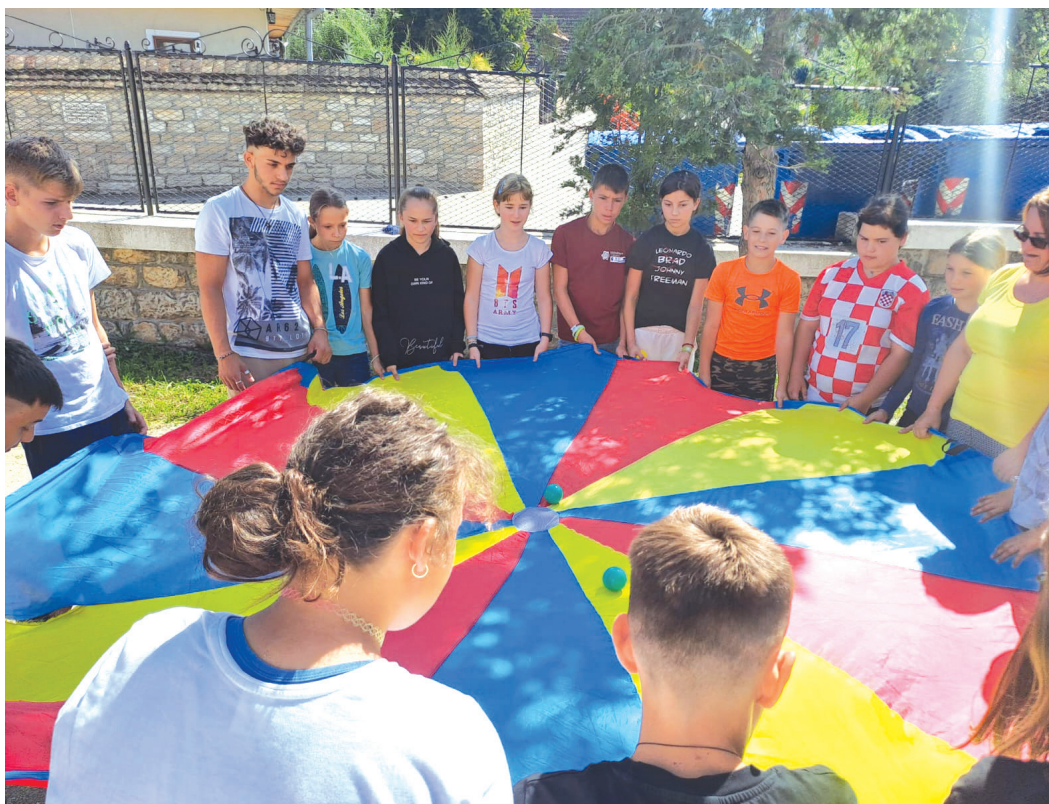
Az adományoknak köszönhetően remélhetőleg a gyermekek a zsoboki iskolában és otthonban maradhatnak

– Jelenleg 28 gyermek él az otthonunkban. Tudni kell, hogy az új gyermekvédelmi törvény hét év alatti gyermekek elhelyezését nem engedélyezi. A 7 évnél kisebb gyermekek nevelőszülőknél vannak, az otthonban a fiatalok 7 és 18 év közöttiek. A nyolcadik osztályosnál idősebbek az intézmény költségén bentlakásban élnek. Egyik diákunk Szamosújváron lakik a Téka Alapítvány bentlakásában, több diákunk a kalotaszéki királyi szakiskola bentlakásában él, illetve néhány gyerek a kolozsvári református kollégium szakiskolájába jár és annak bentla-