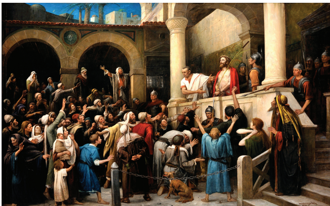
Ecce homo (Íme, az ember!). Munkácsy Mihály világhírű Krisztus-trilógiájának egyik remekműve

Pilátus. Kényesen vigyázott Róma, a megszálló hatalom tekintélyére. Abban a huzavonában, az elítélés hatalmi játszmájában igazából a Jézus halálát már eldöntött zsidó nagytanács és Pilátus között a félelem kapcsa működött. Egy-másra mutogattak. Ki vállalja el a halálos ítélet kimondását? A Jézus királyi volta körüli megálázó vitában Pilátus az igazságot kereste – Rómának jogérzékkel és hatalmi „mosom kezem” látszattisztasága fenntartásával. Világossá tet-