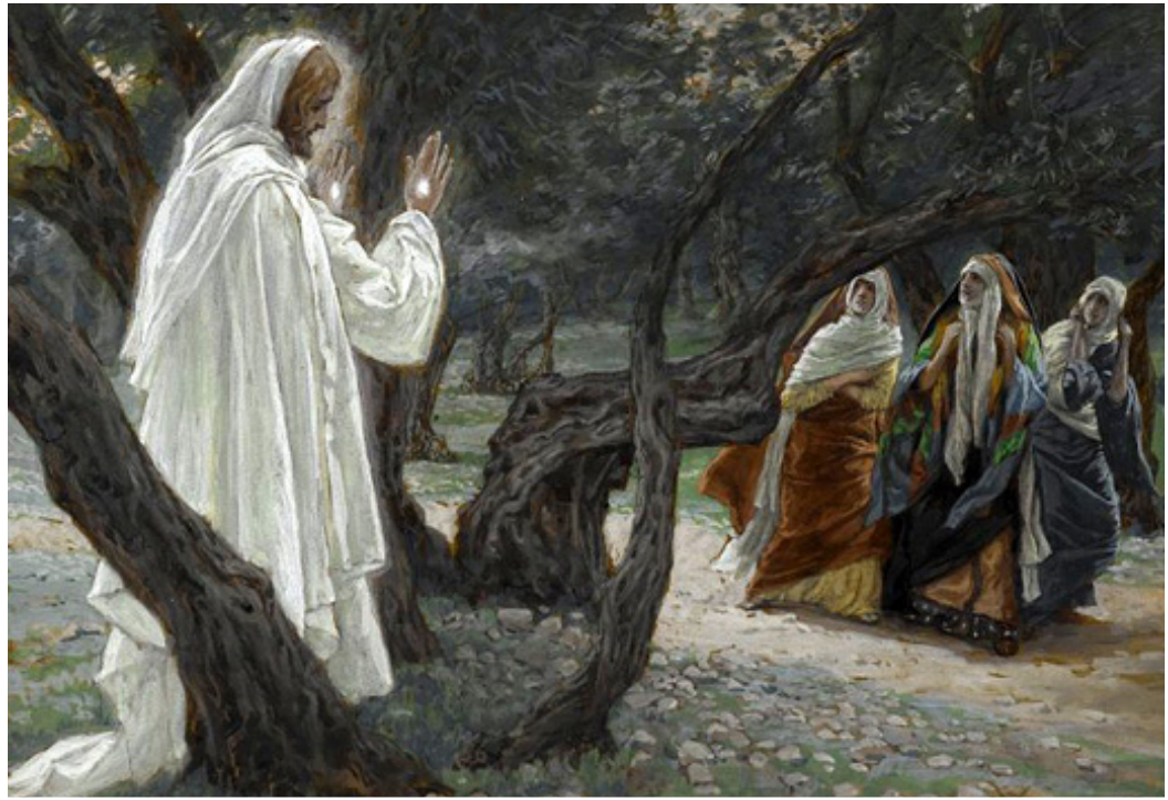
A feltámadt Krisztus megjelenik az asszonyoknak. James Tissot francia festő alkotása a 19. századból

Mi nem érdemeltük ki a megváltást. Mindannyian a tékozló fiúhoz hasonló életet élünk, de mégis részesülünk Isten kegyelmében. Ami-