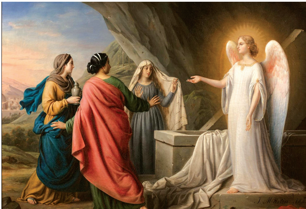
Három asszony az üres sírnál. Irma Martin francia festőművész alkotása 1843-ból

Látjuk a „félelemtől megrettent” öröket s a „félelemmel és nagy örömmel” tovafutó asszonyokat, akik viszik a feltámadás hírét. Látjuk őket, és az ige arra készlet, hogy nézzünk lelkünk mélyébe: félelem és rettegés vagy a feltámadottat kereső, az angyal szavában az Isten üzenetét meghalló és a sírban a testet nem lelő lélek öröme lakozik-e bennünk? | 3.