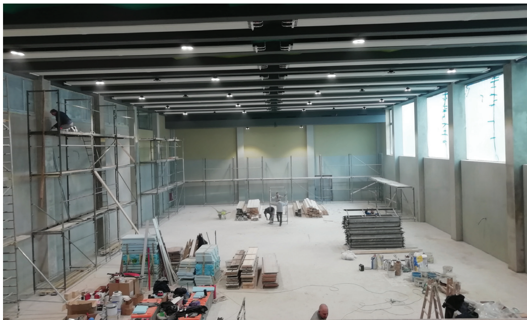
Az elemi osztályosoknak készülő új iskolaépületben a gyerekeket egy modern tornacsarnok várja majd ősztől

Az elképzelések még a világjárvány előtti időben születtek. A tervek során először olyan területben gondolkodtak, amelynek rendezetlen teleküzeyei voltak. Így a látványterveket elvetették, és új területet szemeltek ki az iskola háta mögött, amelyet az egyház a helyi önkormányzattól koncesszióba (engedménybe) kapott. A tanulók elszállásolása is megoldódik, mert a közelben kap helyet a Református Diákoththon Alapítvány bentlakása is, az egyház ugyanis a volt Európa szálló épületét udvarral együtt vásárolta meg. Az egykori szállodát idővel bentlakássá alakítják, ám jelenleg éppen azok