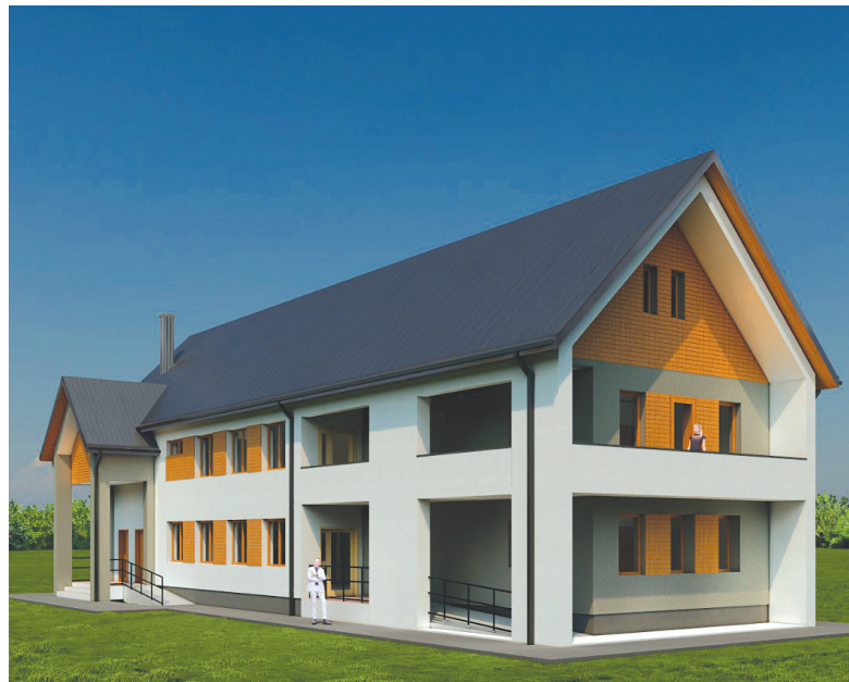
A tervbe vett családi típusú zsoboki gyermekotthon látványterve

• Imádkozzunk a zsoboki gyülekezetért és a megkezdett munkáért!