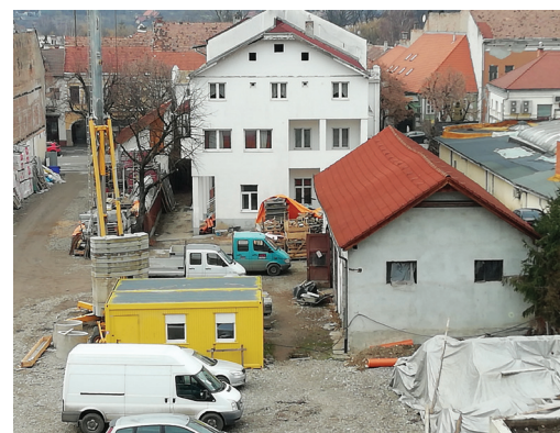
A tornacsarnok tetején udvar lesz, amelyre az osztályokból lehet rálátni, mellette sportpálya helyezkedik el, a lépcsőkről pedig a lentebb fekvő bentlakáshoz lehet lesétálni