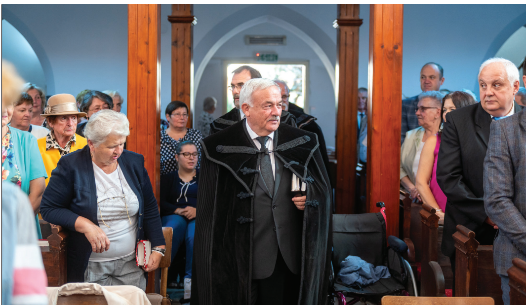
Generális vizitáció a Dési Református Egyházmegyében. Kató Béla püspök a beszercei hívek körében

– Sajnos e téren nem állunk jól. Az urbanizáció egyre erőteljesebb, a városra költözők nem jelennek meg az egyházi statisztikában. A lelkészek pedig azt gondolják: a „hagyományos” munka elégséges. Igét hirdetnek, esketnek, temetnek, ám ez inkább „szervízszolgálat”. Kiszolgálják azt, aki jön. Misszióra pedig alig van jel. A misszió nyilván rendkívül fárasztó, sok utánajárást igényel, egyenként kell megszólítani az embereket, s később bekapcsolni a gyülekezeti életbe. Erre nincsenek felkészülve a városi gyülekezetek, és ha nem történik változás, az elkallódó lelkek nem épülnek be a közösségekbe.