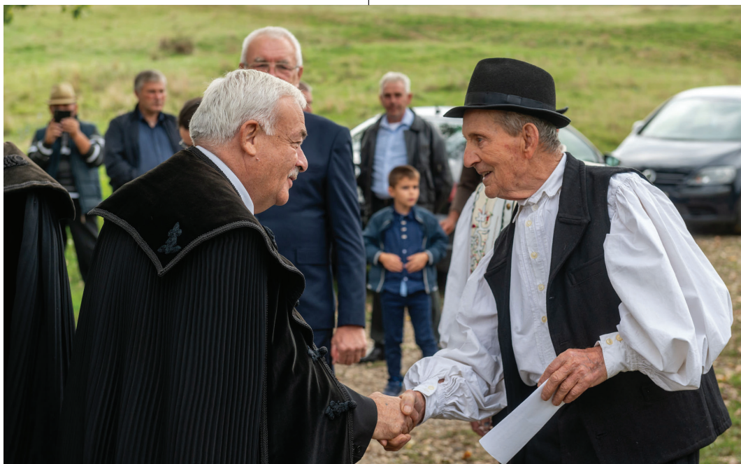
Egyházlátogatás a Mezősegen. A püspököt Mezőkeszűben is örömmel fogadták

– Minden évben törekszünk arra, hogy legyenek csúcsrendezvények. Szerintem minden közösségnek – az összetartozás megéléséhez, hitbéli erősödéséhez – szüksége van kiemelt alkalmakra gyülekezeti, egyházmegyei, kerületi, sőt Kárpát-medencei szinten is. Olyanokra, mint a tavalyi bonyhai vagy azelőtt a gyulafehérvári volt. Idén több intézmény végleges átadására kerül sor Erdélyben, amely köré közösséget szeretnénk szervezni. Ilyen Székelydvarhelyen a református kollégium, amely nagy beruházás. Remélem, Kolozsváron a repülőtér mellett átadhatjuk az erdélyi gyűjtőkönyvtárat, a magyar opera kelléktárat, ezek a nemzet, a közösség ügyét szolgálják. Kolozsváron a Házsongárdi temető mellett elkészül a parkolóház, befejezzük az utolsó napközit, a kulturális élet szempontjából jelentős Bornemissza–Szilvássy-kúria felújítása is befejeződik (a Monostori út elején), mint ahogy a nyárádszentbenedeki templom újjáépítése is. Augusztus elején Zeteváralján a Válság iránt! ifjúsági fesztiválra pedig ismét több ezer fiatal várunk. Kárpát-medence szintjén megünnepeljük a református egység