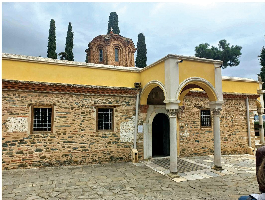
A görög Thesszalonika városának számos nevezetessége van. Ma a településen egymillió lakos él

Csapatunk mind az 54 tagja lelki élményekkel meggazdagodva térhetett haza, bárcsak tudnánk mi is hűséggel követni és hirdetni azt a Krisztust, akit Pál is követett és hirdetett.