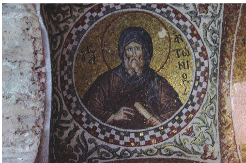
Remete Antal képe egy bizánci mozaikon (Isztambul)

Antal személyét több legenda, személyes bizonyosságtételű leírás rögzíti. Húszéves korában szüleinek halála után tekintélyes vagyoni birtokába jutott. Az volt a szándéka, hogy vagyona gondozásának és húga nevelésének él. Alig telt el azonban hat hónap, amikor a templomban a gazdag ifjúról szóló prédikációt hallotta. Szívébe zárta az Úr szavát: „Ha tökéletes akarsz lenni, eredj, add el vagyonodat, és oszd ki a szegényeknek, és kincsed lesz a mennyben, és jer és kövess engem.” (Mt 19,21) A 300 holdnyi birtokát szétosztotta, elajándékozta ingóságait, s a remeték közé vonult.