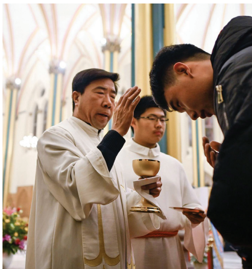
Ázsiában minden harmadik keresztyént üldözik

Ázsia nem növekszik olyan gyorsan, mint Afrika, de a keresztyénség eddig nem feltételezett növekedését ott is tapasztalják. Jelenleg több mint 400 millió keresztyén él Ázsiában. 2050-re ez a szám megközelítheti a 600 milliót. A régióban több keresztyén él majd, mint Európában, s csupán Afrika, valamint Latin-Amerika (678 millió) lesz előtte.