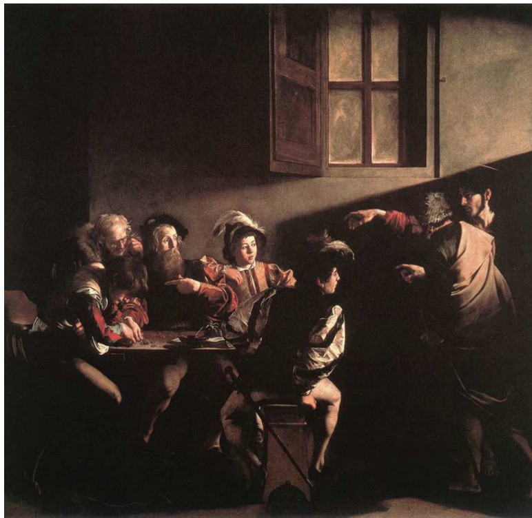
Máté elhívása. Caravaggio itáliai festő alkotása

Jézusnál jobban senki sem mondja el nekünk, mit tegyünk megmaradásunk, értékeink megőrzése és üdvösségünk érdekében. Ha az ő pa-