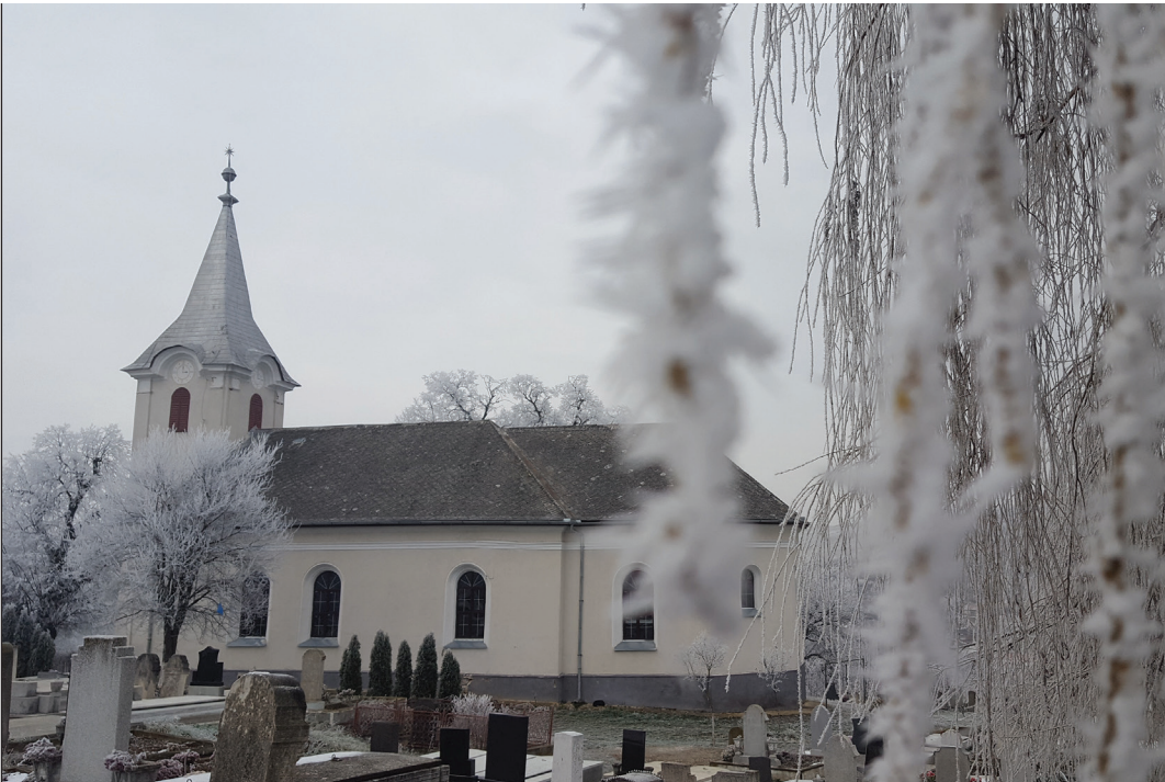
A vámosgálfalvai református templom télen