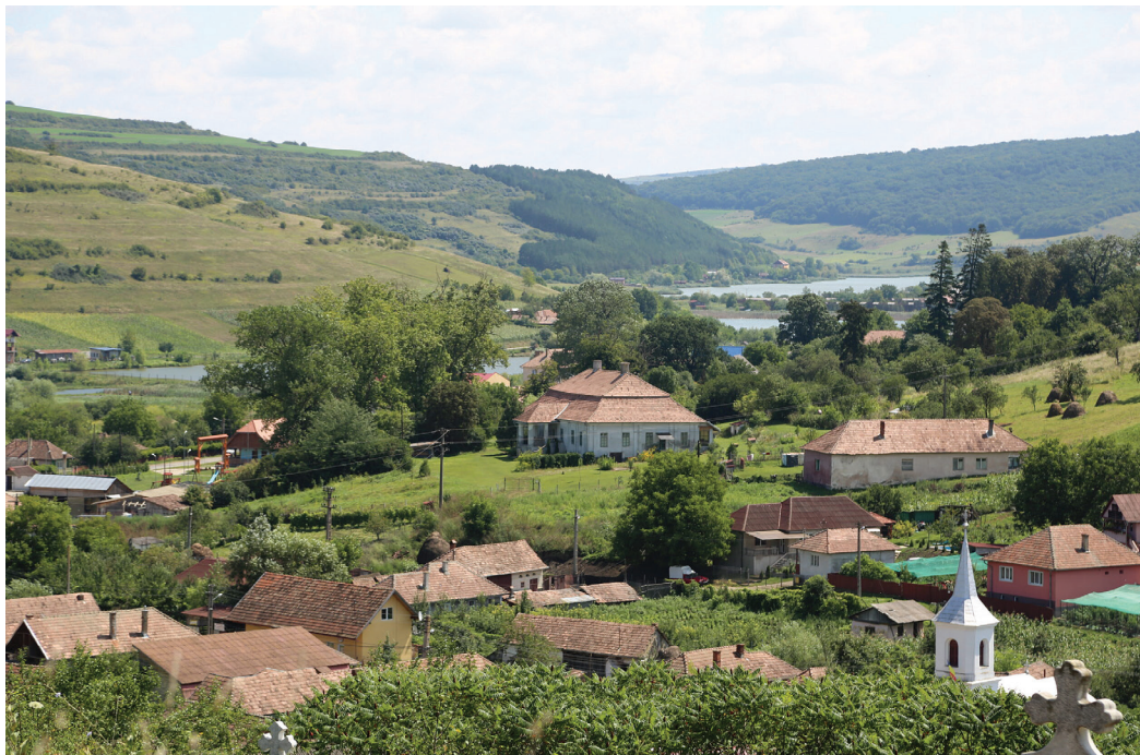
A cegei Wass-kúria az egyetlen megmaradt Wass-kastély a Mezőségen

Régen úgy érezte, hogy magyarsága természetes megélését nem veszélyeztetheti semmi. Otthon, ma, már csak egy-két korbéli szomszédjával és a templomban beszélhet magyarul. Régóta nincs a faluban bál, nincsenek keresztelők, esküvők. A televízióban inkább már csak a román nyelvű csatornákat nézi kedvtelenül, a román népzene hallgatja fásultan. Beszélni is csak ezekről lehet a többségben levő, más nyelvű embertársaival. Reménykedik, hátha egyszer valaki még megszólaltatja a faluban a rég hallott magyar nótákat, dalokat, zenéket. Gyermkeivel még magyarul beszél, de az unokákkal már nem. „Született dédunoka! Hogy is