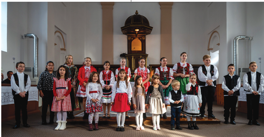
A megújult templomért tavaly ősszel tartott hálaadó istentiszteleten a fiatalok rövid műsort mutattak be

– Az egyik kedvenc ígéret osztom meg az olvasókkal: „mindenre van erőm a Krisztusban, aki engem megerősít” (Fil 4,13). 21 évi szolgálatom alatt, de azelőtt is, mindig éreztem, hogy létezik valaki, aki erőt ad minden helyzetben. Gyakran tapasztalom, hogy a saját erő nem elég, ez az ige pedig olyan bátorítást és lendületet ad nekem, amellyel sikerül elvégezni a munkát. Azzal vágunk neki a 2024-es esztendőnek, hogy soha ne ijedjünk meg az elénk tornyosuló feladatoktól, mert Isten mindig erőt is ad azok legyőzéséhez. Ezzel a hittel és tudattal sok mindent megvalósíthatunk Isten dicsőségére, egyházközségeink javára.