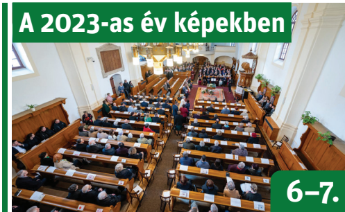
A 2023-as év képekben