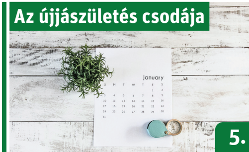
Az újjászületés csodája