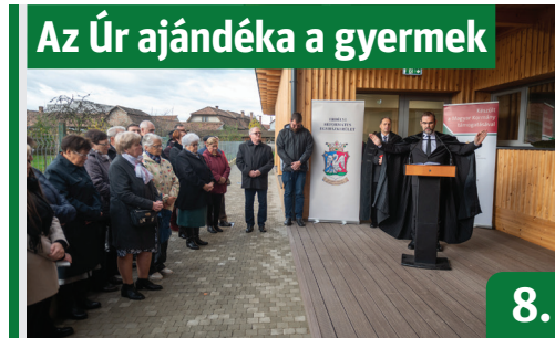
Az Úr ajándéka a gyermek