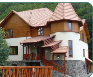
PARAJD Urbán Andor Református Konferenciaközpont 537240 Praid Str. Zsögöd nr. 553 0730-190.067 uarkkparajd@gmail.com