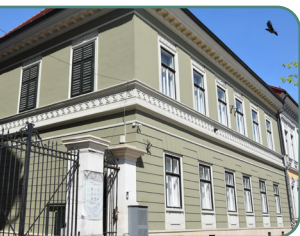
KOLOZSVÁR Erdélyi Református Múzeum 400124 Cluj-Napoca P-ța Avram Iancu nr. 14 0722-540.693 erdelyireformatusmuzeum@ gmail.com