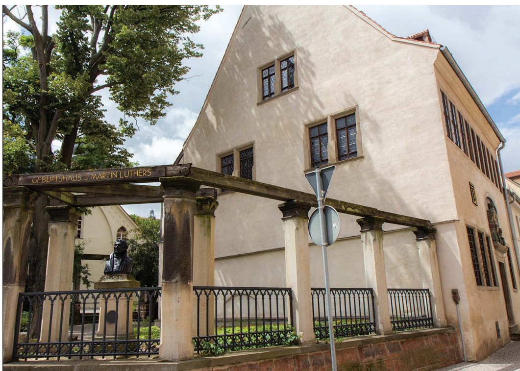
Luther szobra és újjáépített szülőháza a németországi Eislebenben (ma Lutherstadt)

A történészek elmondják, mennyi mindent hozott a reformáció: mit teremtett a kultúrában, a nemzeti nyelvek fejlődésében, a tudományok fellendülésében, a jogban, az államok formálódásában, a gazdaságban és így tovább. Protestánsként büszkék vagyunk erre, de azt is tudjuk, ennél sokkal többről van szó. | 3.