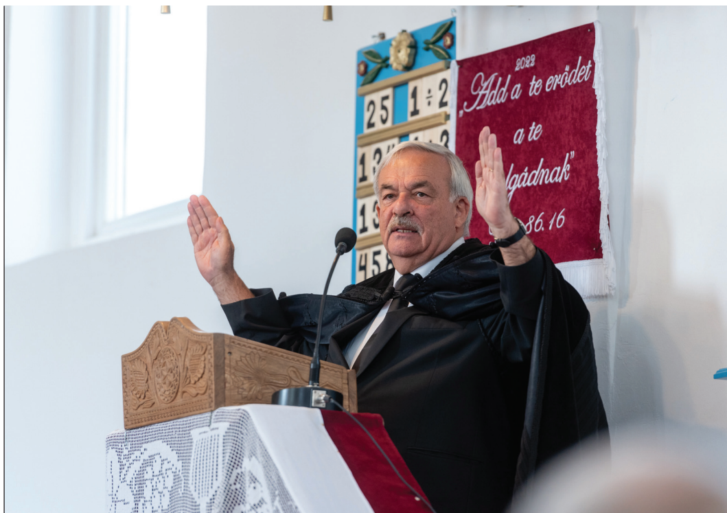
„A mi segítségünk legyen Istentől!” Kató Béla püspök ígét hirdet a felújított márkodi templomban

– A bánffyhunyadi óvodaépítést 17 helyi szervezet kezdeményezte, ezek arra kérték minket, elnyert pályázatukat fogadjuk be, és az egyházkerület keretében kerüljön sor az óvodaépítésre. Így kerültünk bele a történetbe, amit szívesen vállaltunk. A polgármesteri hivatal