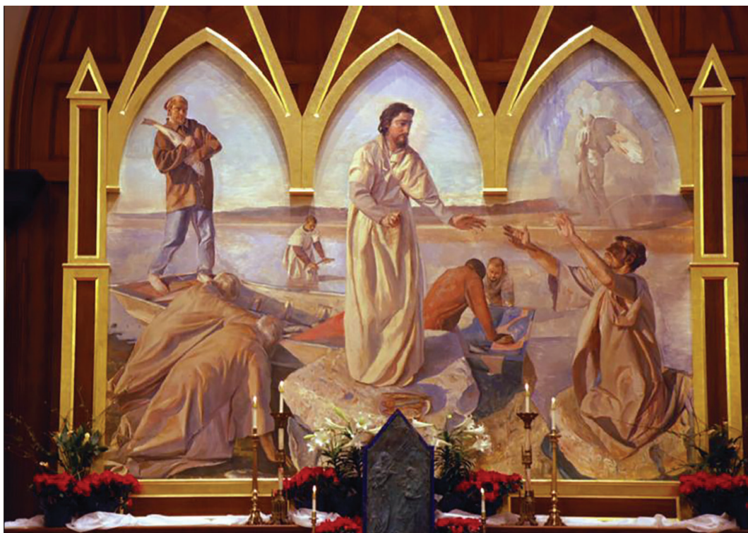
Péter bűnbánata. John Collier festménye (Szent Péter-templom, Charlotte, Észak-Karolina, Egyesült Államok)