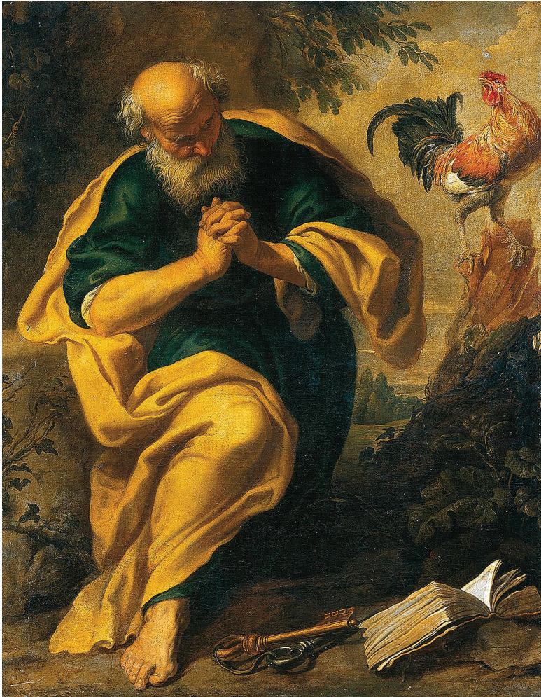
Péter bűnbánata. Gerard Seghers 16. századi flamand festő alkotása

1. | Ezáltal megtanuljuk dicsőíteni őt, amikor belátjuk, hogy amit velünk cselekedett, az volt a legnagyobb szükségünk. Mert nagy különbség van az Isten és a világ szerinti szomorúság között. Pál apostol e gondolatot így fogalmazza meg: „mert az Isten szerint való szomorúság üdvösségre való megbánhatatlan megtérést szerez; a világ szerint való szomorúság pedig halált szerez” (2Kor 7,10).