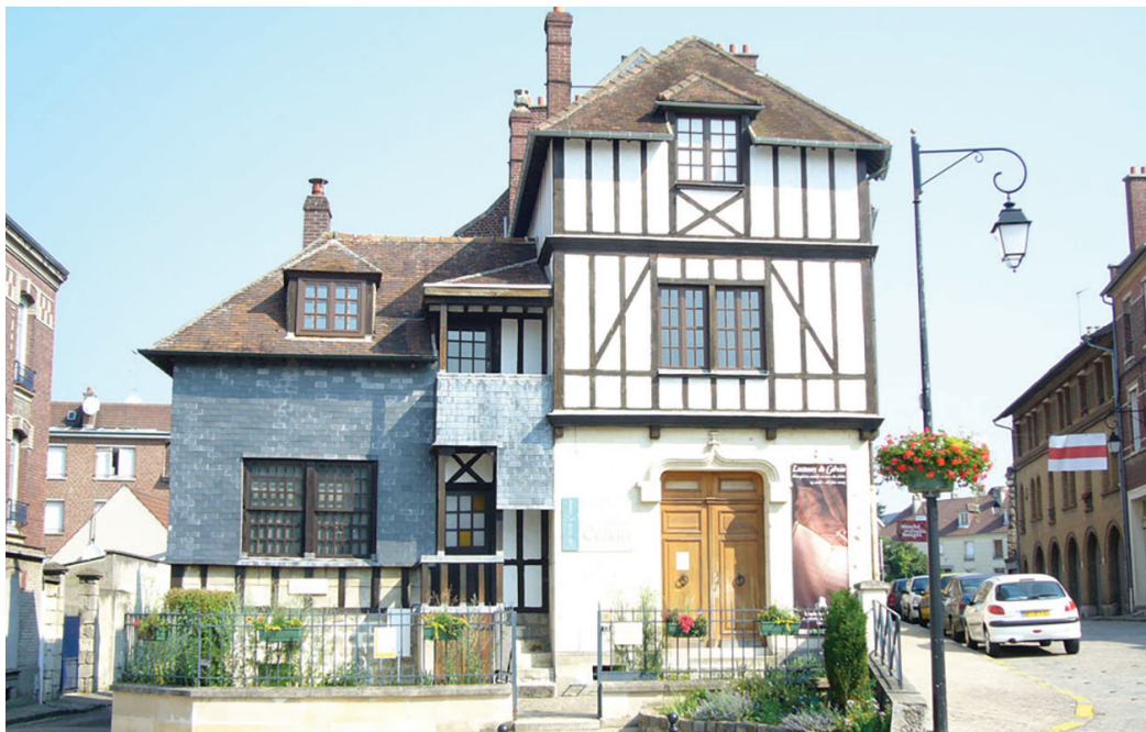
Jean Calvin-múzeum a franciaországi Noyonban. Az épület a reformátor szülőházának helyén épült

A párizsi diáknegyedben számos könyvtára, nyomda is volt. Különösképpen a Rue Jean de Beauvais-en. Ezeknek fontos szerepük volt a régi és bibliai szövegek terjesztésében. Segítőségükkel terjedtek a reformáció eszméi, felismerései, hitújító gondolatai. A híres könyvmetező és nyomdász, Robert d'Estienne adta ki a teljes Bibliát, s ennek tudományos jegyzeteit heretikusnak minősítette a katolikus tanhi-