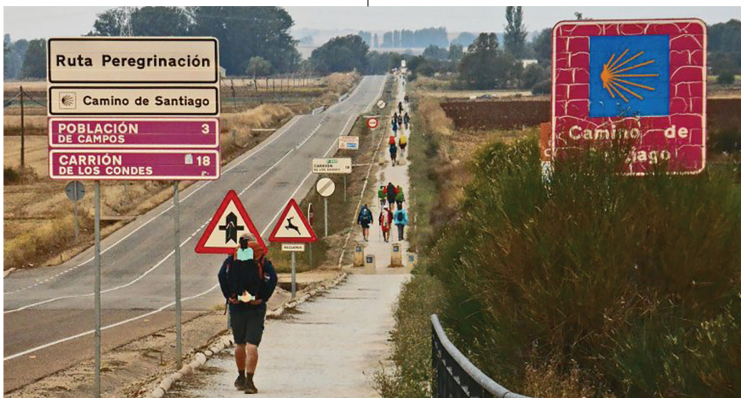
El Camino. A gyalogtúra során a zarándoktársak, a csend, a hallgatás jó tanítónak bizonyulnak

– Érdekes, mert attól függően, hogy mennyi idő elteltével kérdezik meg tőlem ezt, majdnem mindig mást emelek ki. Nem jelenthetem ki határozottan, hogy az azóta bennem, körülöttem lévő változások mind a Caminónak köszönhetőek. Viszont biztosan segített abban, hogy jobban jelen tudjak lenni, hogy kicsit több legyen a „mi”, „ti”, „ők”, kevesebb az „én”. A zarándoktársak, a csend, a hallgatás, a beszélgetések jó tanítók. E változások az út végével kezdődnek, s soha véget nem érők.