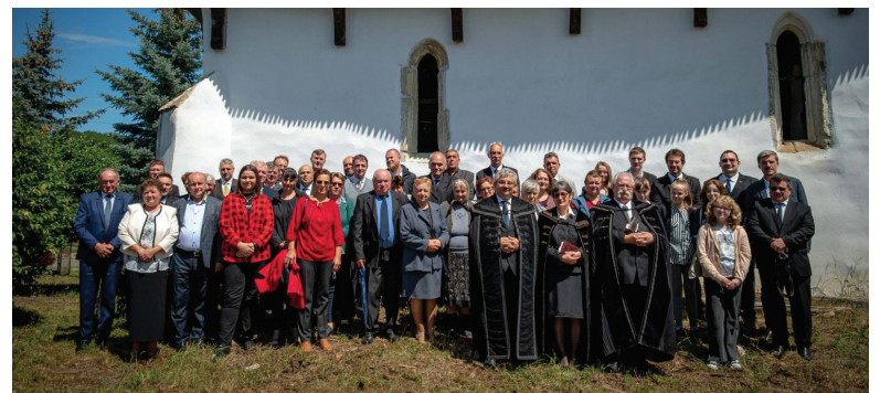
Sajósárvár templomában minden évben egy alkalommal tartanak istentiszteletet