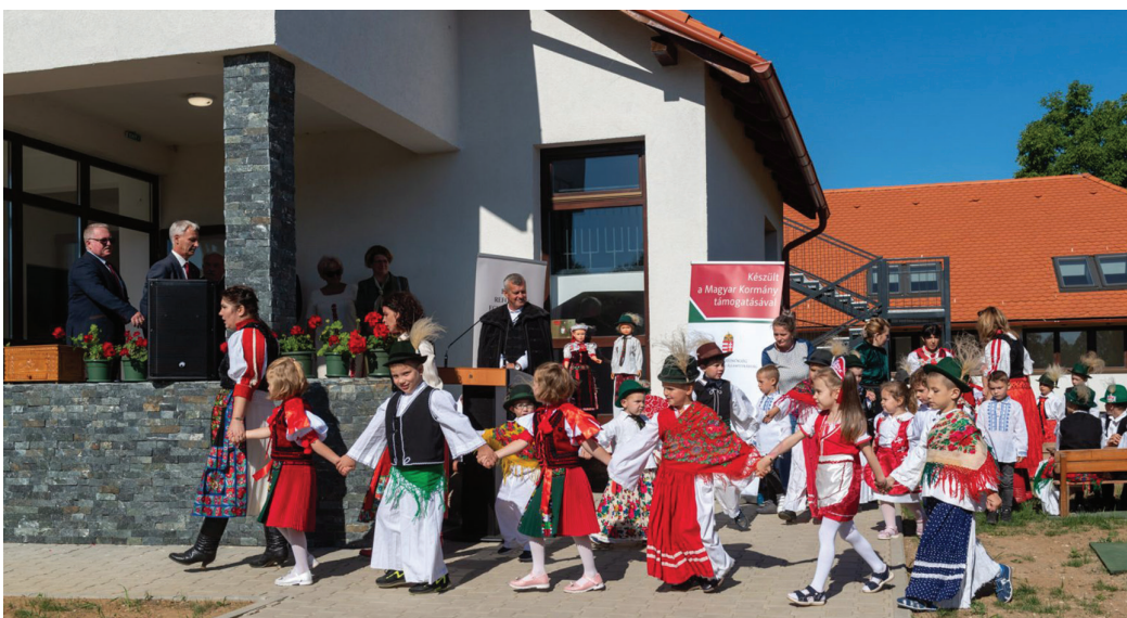
Idén nyáron ünnepélyes keretek között avatták fel Bánffyhunyardon az új óvoda épületét

– Sokszor tapasztaltam azt, ami erőt is adott: merjél bízni az Úrban, add át magad neki, és csodákat fogsz látni. Ugyanakkor idéznék a 2Kor 7-ből: „mert az Isten szerinti szomorúság megbánhatatlan megtérést szerez az üdvösségre”. Szép ige, mert beszél a jelenről és a jövőről. Ha mi nem a jelent nézzük, a körülöttünk levő nyomorúságot, a krízist és a háborút, hanem az üdvösséget, akkor fel kell vállalnunk a szenvedést is, s bízunk kell abban, hogy az Úr a rosszat is javunkra tudja fordítani, mint József esetében.