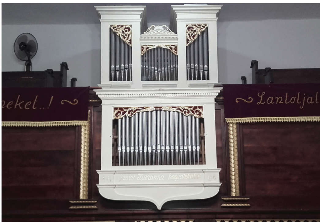
Az érmelléki Csokaly református templomának felújított orgonája