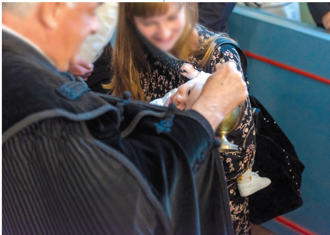
(a kép illusztráció)