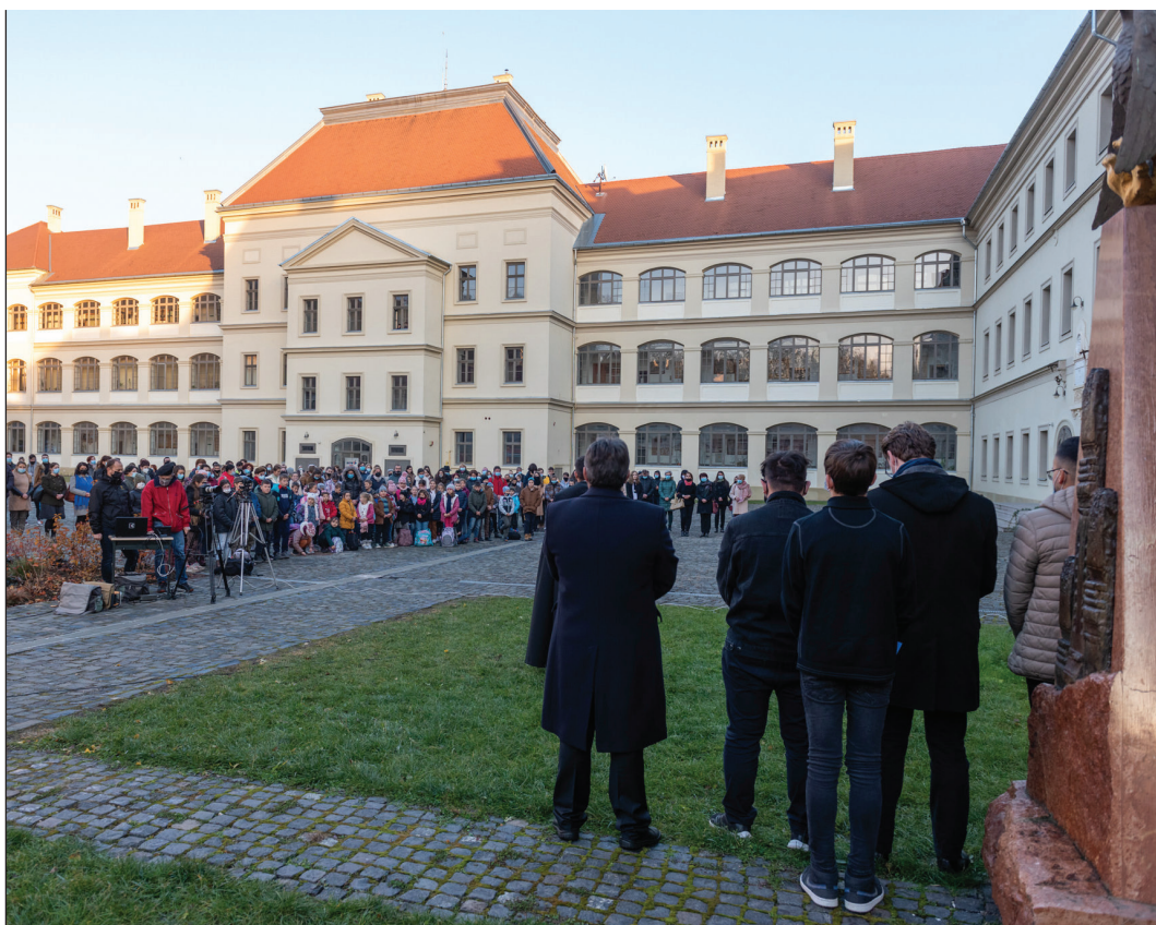
A nagyenyedi református kollégium elődjét Bethlen Gábor erdélyi fejedelem alapította 400 évvel ezelőtt