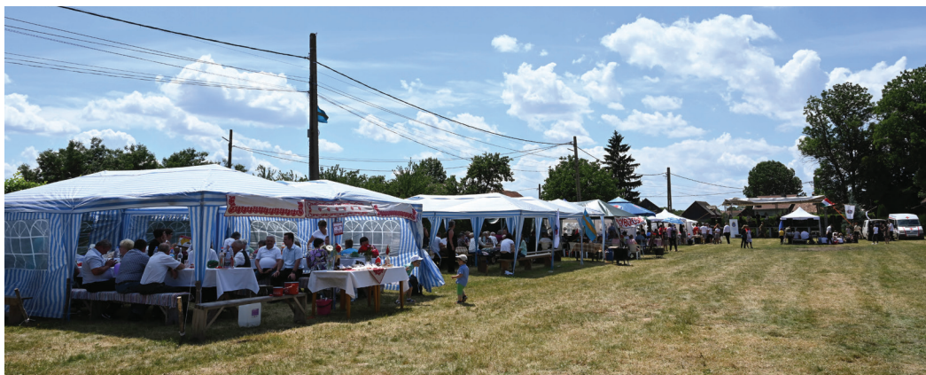
A szörcei gyülekezeti nap alkalmával nem maradhatott el a hagyományos bográcsőzés sem