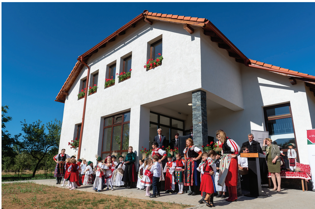
Az új bánffyhunyadi intézmény ősztől három óvodai és két bölcsődei csoportot fogadhat be

Kelemen Hunor romániai miniszterelnök-helyettes sarokkőnek nevezte az anyanyelvi oktatást, amelyre szükség van kultúránk megőrzéséhez, egy erős közösség építéséhez. Egy város erejét sem a falak adják, hanem az ott élő erős közösség – hangsúlyozta az RMDSZ elnöke, majd hozzátette: „mi már rég eldöntöttük, hogy erős, sikeres magyar közösségként akarunk megmaradni szülőföldünkön” – ehhez járul majd hozzá Kalotaszeg az új óvoda és az épülő iskola.