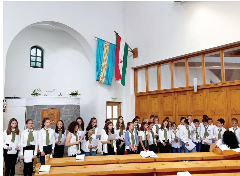
A mikós és a medgyesi gyerekek a sepsiszentgyörgyi belvárosi templomban

Szórványprogramunk a nyári vakáció első napjaiban a medgyesi diákok sepsiszentgyörgyi látogatásával folytatódott. Programindítónak a sepsiszentgyörgyi Cimborák Bábsházában A fák titkos szíve című előadásra vettünk részt. Ezt egy afrikai népmese ihlette, aminek a témája szoros kapcsolatban áll a Bibliából ismerős élet fájával. A várost és környékét