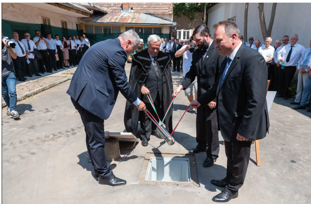
Új ingatlan épül a két iskola elemi osztályainak. Az alapkövet július 1-jén helyezték el