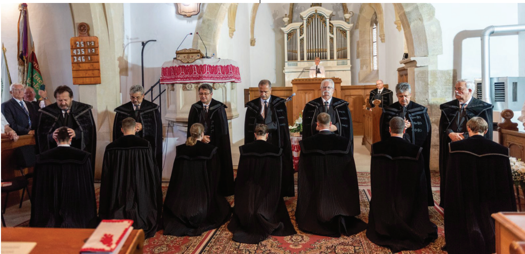
A közgyűlés első napján Gernyeszegen hét fiatal lelkipásztor felszentelésére került sor

A továbbiakban Szegedi László missziói jelentése hangzott el. Újra lélekszámapadás történt, egyházkerületünkben 2021 végén 267 779 reformátust számláltak. Továbbra is jellemző a szóróanyagok, kisebb falvak és kisvárosok elnéptelenedése, de nehézséget jelent a nagyvárosokba beköltözők megtalálása is. A járvány utáni lazításoknak köszönhetően jelentősen megnőtt a házasságkötések száma, és bár az elmúlt két évet a templomlátogatók számbeli csökkenése jellemezte, a belmissziós munka eredményeként sokan visszatértek a templomokba. Még mindig sokan félnek közösségbe menni, de a vasárnapi istentiszteleteken való részvétel újból átlépte a kritikus 10 százalékos pszichológiai határt: 11,56 százalékosra emelkedett. A bibliaórák, vallásos ünnepélyek, ifjúsági rendezvények, szeretetvendégségek, imaheti szolgálatok esetében nem sikerült a járvány előtti időszak mutatóit elérni. A missziói előadó szerint örömdetes, hogy sok ifjú lelkes a mai kor generációjának nyelvén és eszközeivel közelít az ifjakhoz. A belmissziós szövetségek sorában a nőszövetség lendületével és hitével csodákat művelt. A Presbitéri Szövetség is újrendezte sorait. Az IKE és a cserkészmozgalom tevékenységét lassította legkevésbé a világjárvány, ám a gyülekezeti diakónia és a Diakónia Keresztyén Alapítvány is fejlesztette tevékenységét. A gyülekezetek jövője attól függ, mennyire veszik komolyan a vallásoktatást és katekizációt – hangsúlyozta Szegedi László.