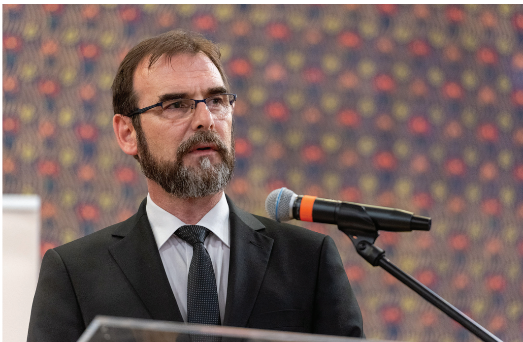
Az egyházkerületi közgyűlésen dr. Kolombán Vilmos teológiai rektort választották meg püspökhelyettesnek

1. | Az esperesi vizitációk során kiderült, egyes gyülekezetekben 2020 márciusától letették a lantot a járványra való tekintettel – becsukták az anyakönyveket, a lelkeszi munkanaplót, a gyermekekkel és az ifjúsággal való foglalkozást. Eközben a számos felújítás, építkezés töretlenül működött, és ez örömet és elégtételt jelentett sok gyülekezet életében. „Miközben a növekedésnek, az építkezésnek örvendezünk, addig elesettséget, közönyt, fáradtságot, sőt cinizmust is találunk. Meggyőződésem, hogy az isteni hűségre való rácsodálkozás, az abban való megerősödés menthet meg bennünket attól, hogy a sok elvett jó dacára hálátlanoknak bizonyuljunk, holott Isten kegyelmében hordoz, és megújulásra készítet” – hangzott el.