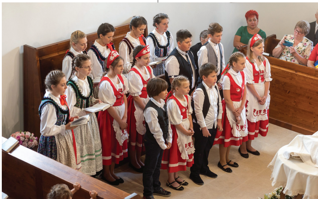
A tordatúri templomszentelés alkalmával az ünneplők a helyi gyülekezet fiataljainak műsorát hallgatták meg

A templom felújítása egyetlen gyülekezet életében sem jelentheti valaminek a végét, hanem egy lépést a folytatás irányába. Hiszen ügyelnünk kell az épületeink megővésére, hogy méltó körülmények között tudjuk folytatni a lelki építkezést, s valódi élettel, hittel tudjuk megőrizni megújított tereinket.