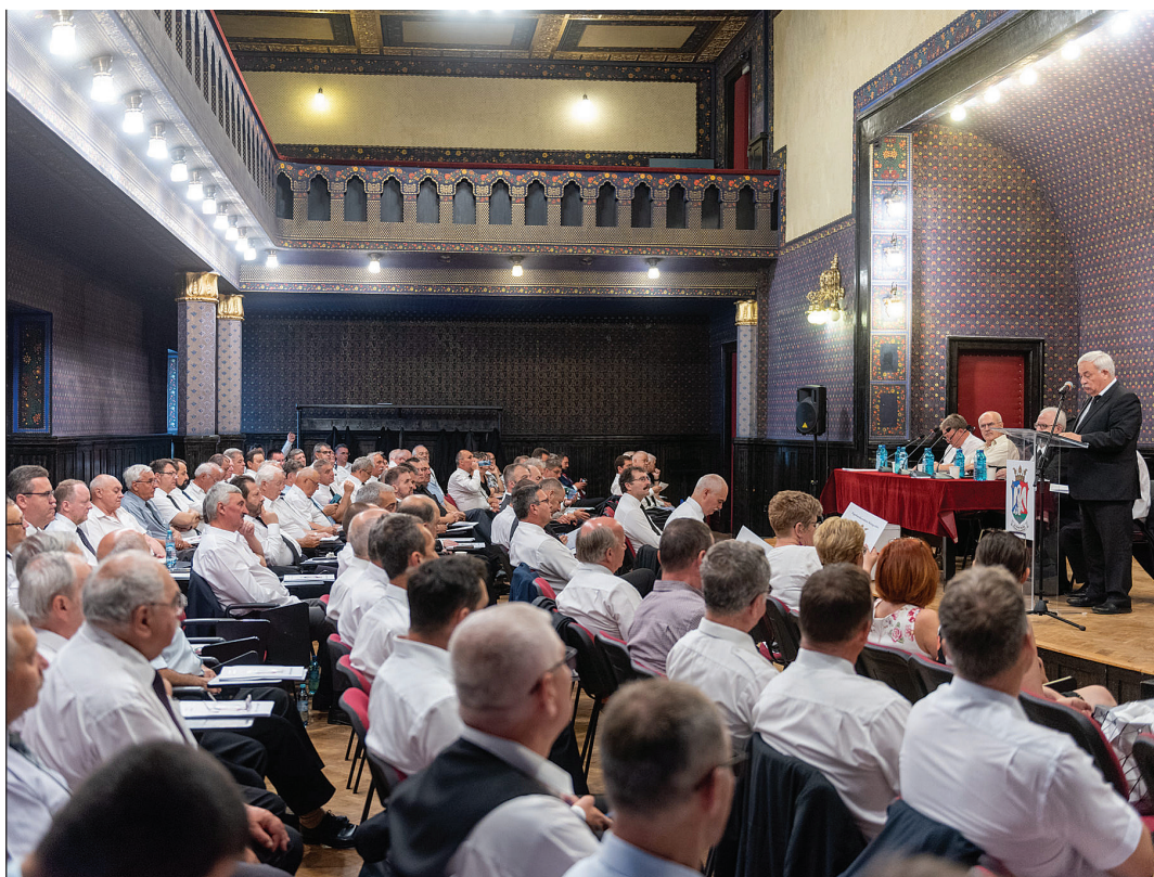
Az Erdélyi Református Egyházkerület közgyűlését idén a marosvásárhelyi Kultúrpalotában tartották