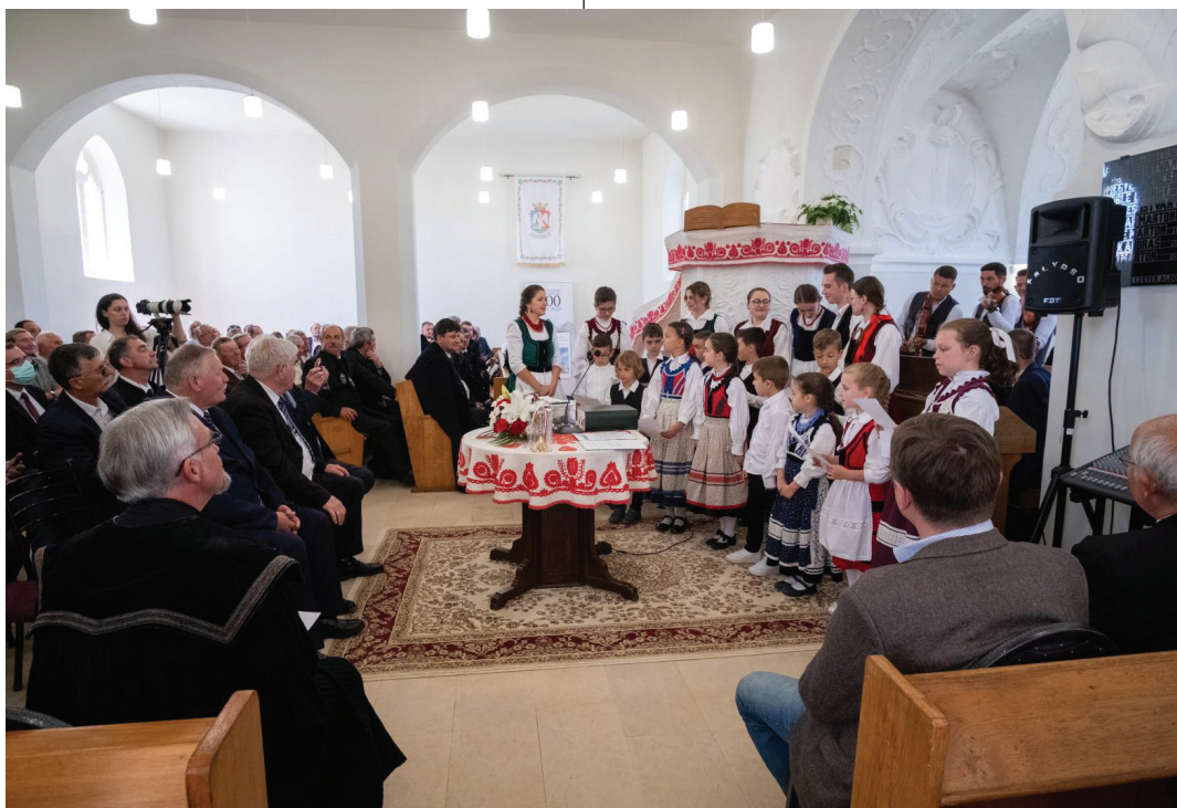
A Csombordon tartott hálaadó istentiszteleten a helyi fiatalok is kivették részüket az ünnepségből