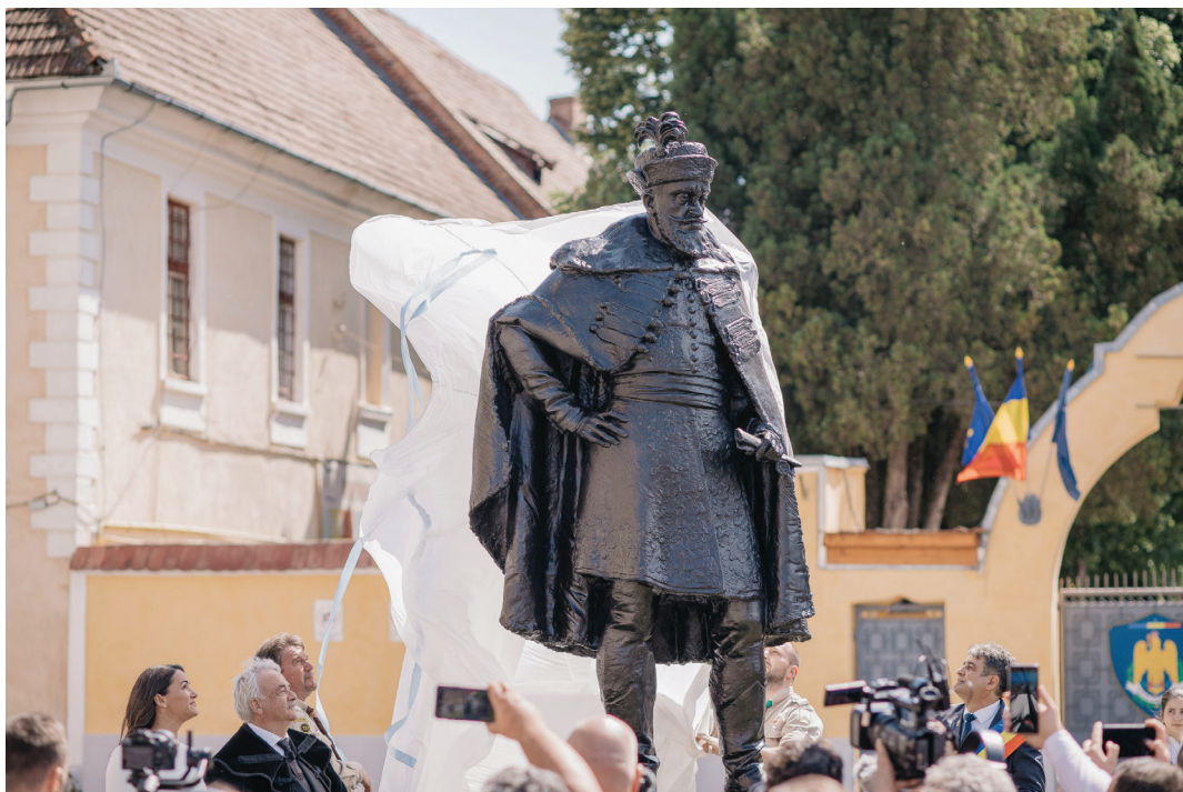
Gyulafehérvár történelmi főterén immár Bethlen Gábor szobra is köszönti az arra járó kirándulókat