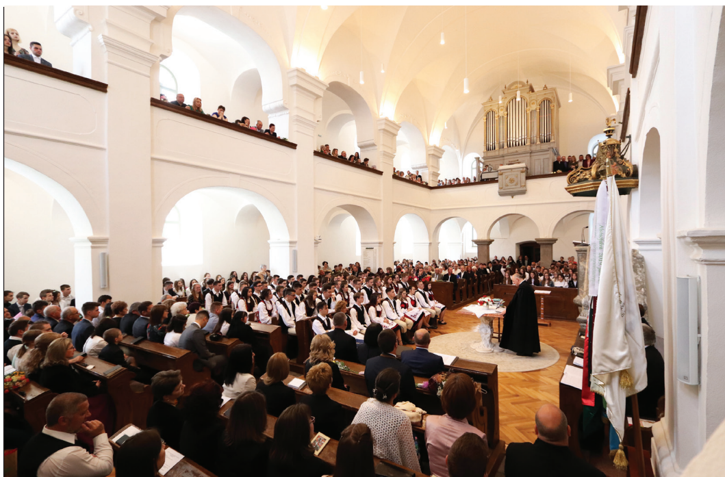
A székelyudvarhelyi református kollégium végzősei május 21-én ballagtak el

A református oktatás 1994-ben indult újra egy osztállyal az állami tanítóképzőben, 1997-ben a Református Teológiai Líceum önálló jogi személyiséggé vált, 2002-ben pedig teljesen független lett. 2002. október 27-én vette fel Baczkamadarasi Kis Gergely nevét, 2004-ben pedig szobrot is állítottak neki. Bethlen János nevét az újraindulás 25. évfordulóján átadott új auditorium őrzi.