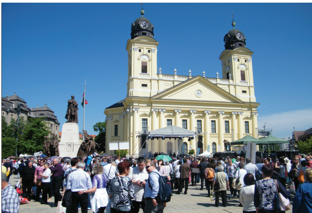
A református egység napját legutóbb Debrecenben ünnepeltük 2019. május 18-án (archív felvétel)