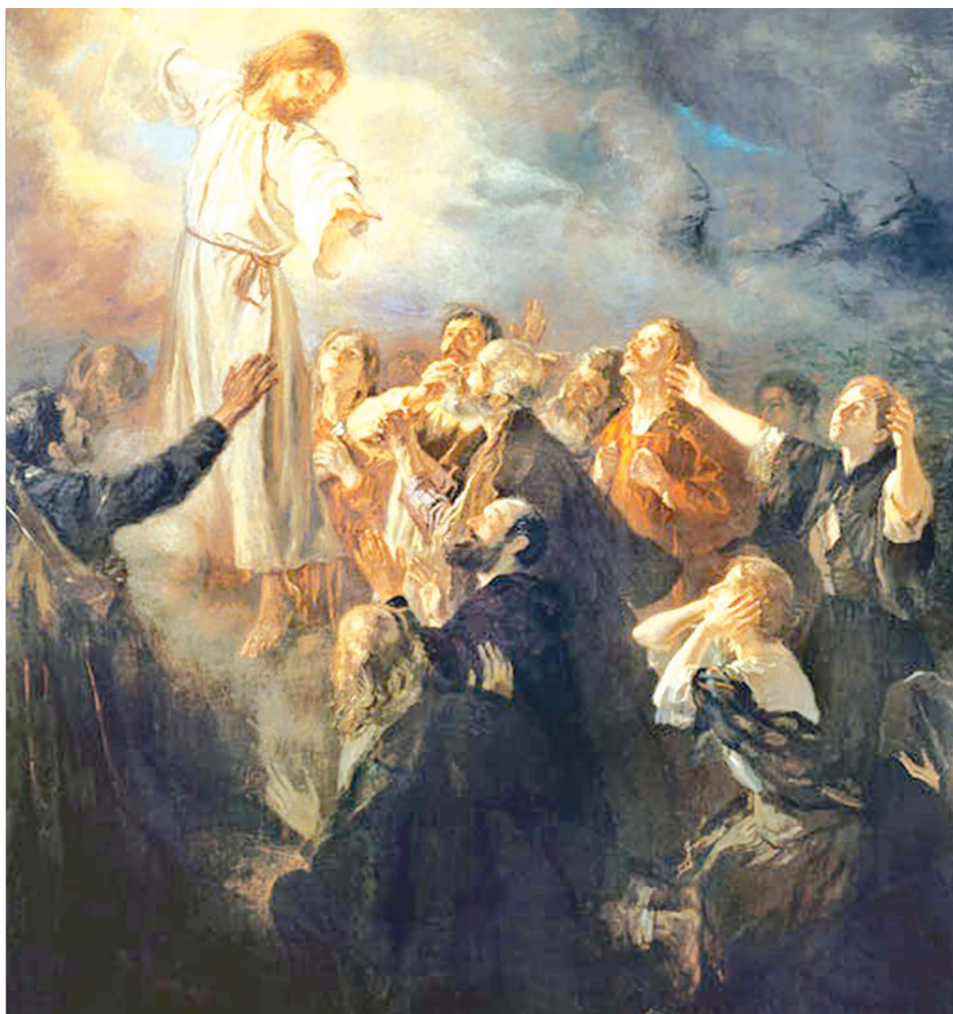
Krisztus mennybemenetele (Fritz von Uhde német festőművész alkotása a 19. századból)

Aki őt követi, mindennekefelett ezt a mozdatot, lelkületet tanulja meg tőle. Az áldás mögött pedig a megbocsátás 33 éve, Jézus lelkülete, erkölce áll: Atyám, bocsásd meg nekik, mert nem tudják, mit cselekednek (Lk 23,34). Itt a tettel igazolt válasz a történelem végéig a péteri dilemmára: Uram, hányszor kell megbö-