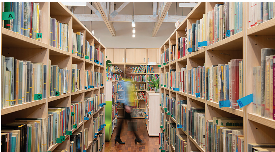
A könyveket egyre kevesebben lapozzák fel, a könyvtárakba egyre kevesebben térnek be

Könyvtáros meséli, hogy szinte hetente megkeresik egy-egy elárvult könyvtár sorsának