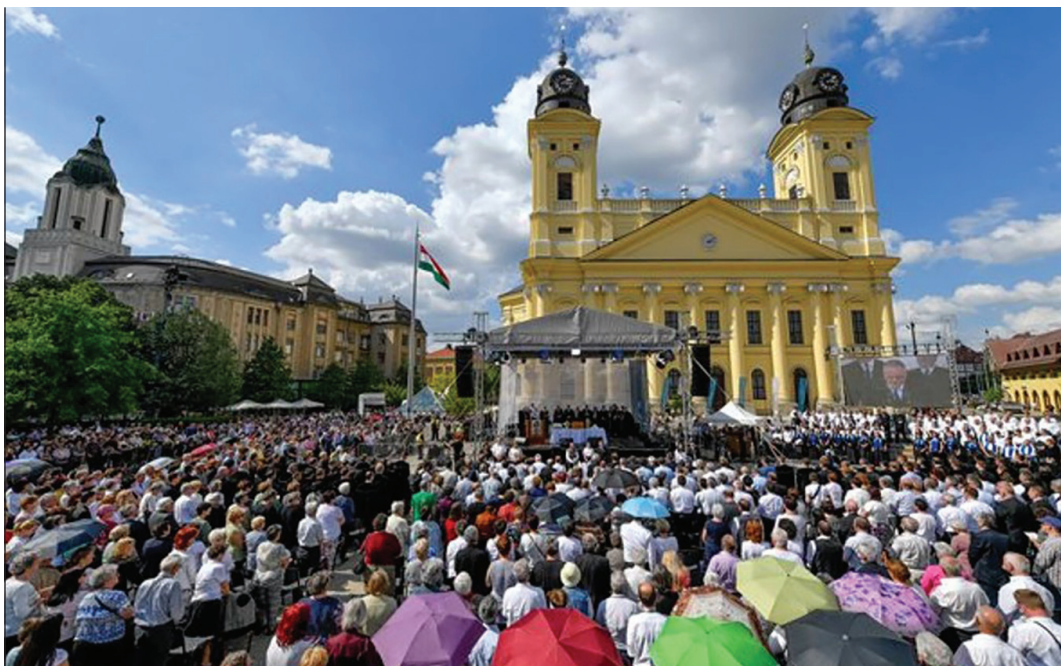
Ünnepi istentisztelet a debreceni Nagytemplom előtt a református egység napja alkalmából (archív felvétel)

A címbéli ígerész reformációi személyes megszólítás. Magatok is! Félelmetesen egyszerű mondatrész. Pedig ez egy egyszerű mondatból kihallatszó nagyszerű bátorítás. Először azt kell kihallanod, hogy te is megszólított vagy, az Úr téged is alkalmasnak tekint. Alkalmas vagy arra, hogy másoknak is elmondd a megértett felismerést. Másodszor nem szabad megijednünk a többes számtól. Nagy kísértés az, amikor sokakat szólítanak, hogy netalán kimaradok. Krisztus az élő kő, de neki megszámlálhatatlanul