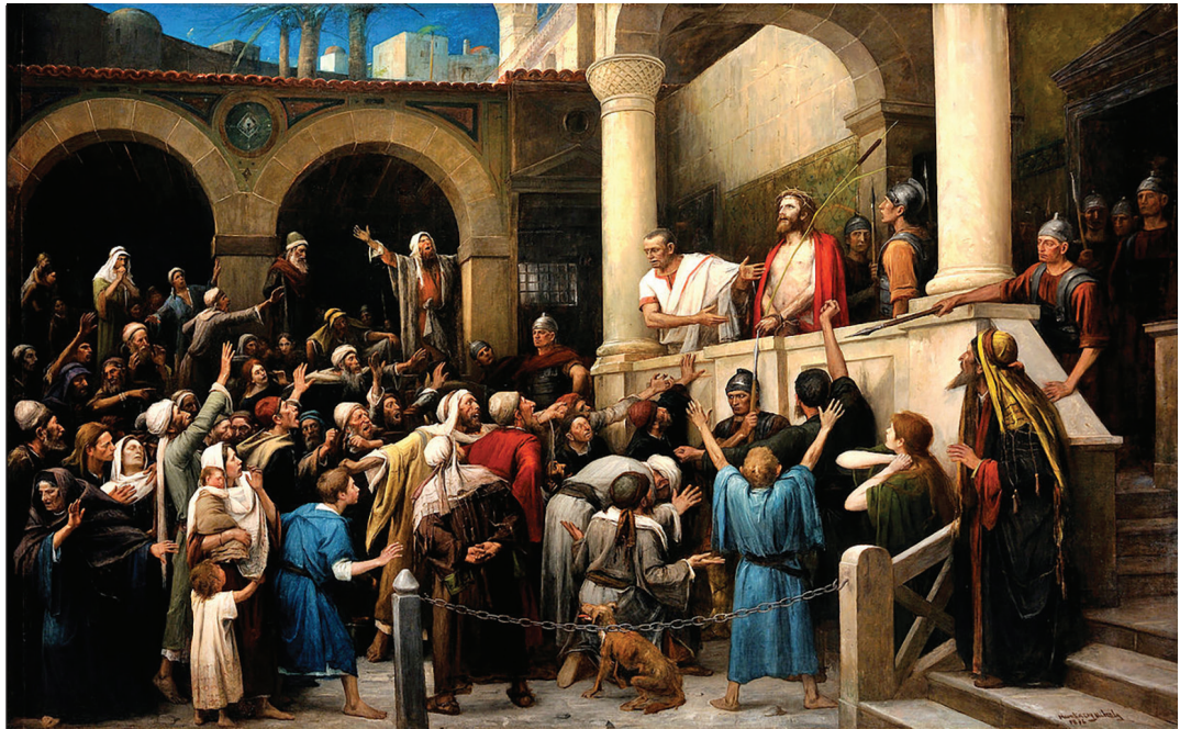
Munkácsy Mihály: Ecce Homo

A történelemben azóta is gördül tovább az ezüstpénz és a Júdás-effektus. Hányan lettek áldozatai az általuk „bevett” látszatnak. Ott voltak valaki mellett, de a szívük, gondolatuk már máshol volt. Jézus mellett Júdás az utolsó vacsorán nem a tanítványok meghittségével mártotta