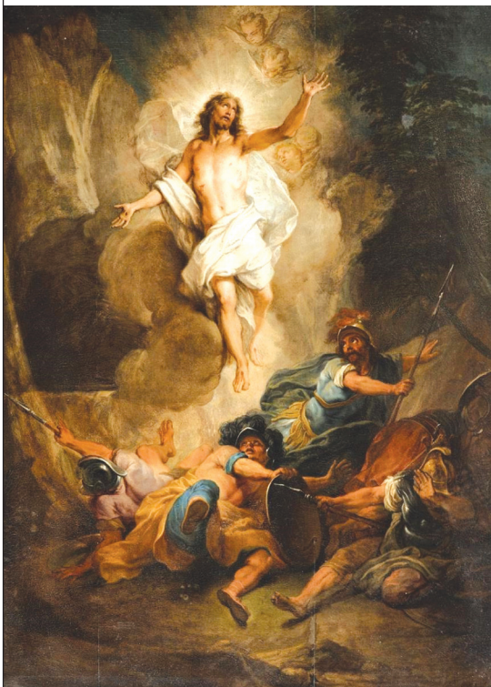
Nicolas Bertin: Jézus feltámadása

A nagypénteki kereszt Krisztus feltámadásának, győzelmének a jele. A keresztyén világ arra emlékezik húsvétkor, hogy Jézus végigjárta a halál útját, de nem maradt a sírban, hanem feltámadt, és velünk marad életünk útján mindvégig.