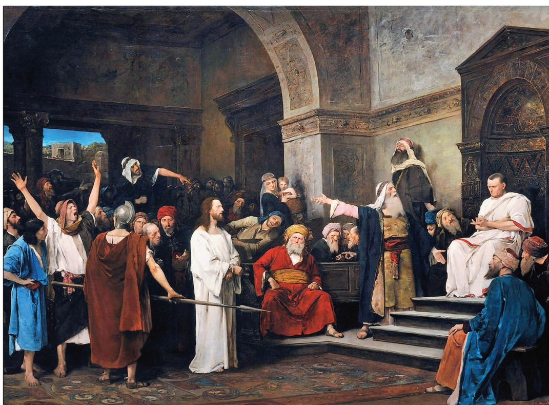
Munkácsy Mihály: Krisztus Pilátus előtt