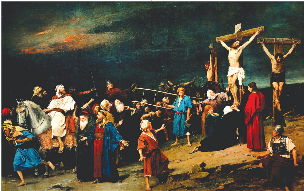
Munkácsy Mihály: Golgota

Két évig a vírustól való félelem keserítette az életünket, most a háborútól való félelem. Kérjük Istent, hogy vegye el félelmeinket, és töltsen meg életünket a húsvéti örömmel.