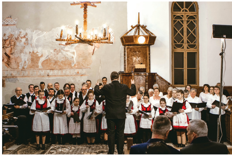
Az ünnepségen a gyülekezet kórusa szolgál