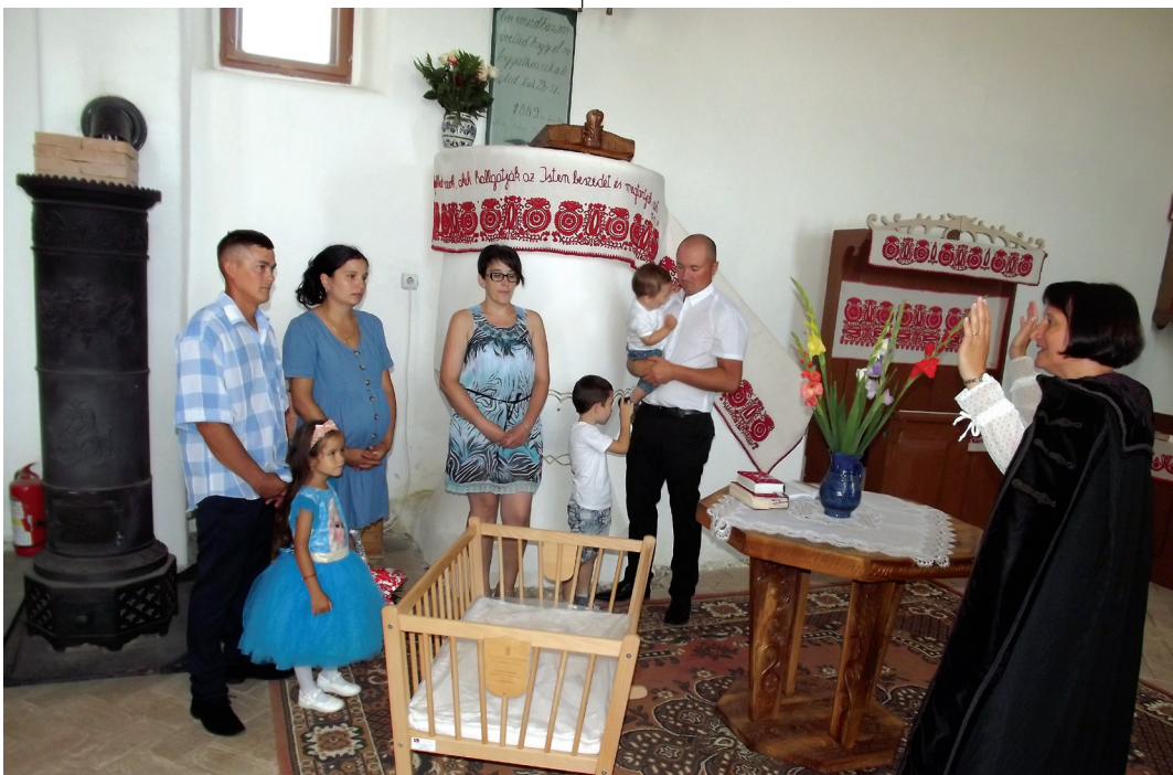
A vándorbölcső átadása. A gyülekezetben mindig az a család kapja a bölcsőt, ahol gyermek születik

– Istenben bízó emberként nem szabad kudarcsunkba belefáradnunk és meglankadnunk. Engem Pál apostolnak az üzenete bátorít, amely szerint nem beszédben áll Isten országa, hanem erőben. Oda kell fordulnunk egymáshoz, hitünknek pedig meg kell mutatkoznia a közösségekben és egyéni életünkben is. Ha e gondolatokat közel engedjük magunkhoz, akkor szívvel-lélekkel tudunk munkálkodni Isten dicsőségére közösségeinkben.