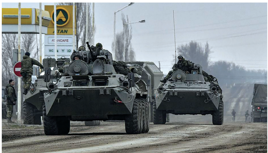
Vonuló orosz tankok Ukrajnában. Számos kelet-európai nép számára sajnos ismerős érzés és látkép

„Jézus így válaszolt nekik: vigyázzatok, nehogy valaki megtévesszen titeket! Mert sokan jönnek majd az én nevemben, és ezt mondják: Én vagyok a Krisztus! – és sokakat megtévesztenek. Fogtok hallani háborúkról, és hallotok háborús híreket. Vigyázzatok, ne rémüljete meg, mert ennek meg kell lennie, de ez még nem a vég. Mert nemzet nemzet ellen és ország ország ellen támad, éhínségek és földrengések lesznek mindenfelé. De mindez a vajúdás kínjainak kezdete. Akkor átadnak titeket kínvallatásra, megölnék benneteket, és gyűlöl titeket minden nép az én nevemért. Akkor sokan eltántorodnak, elárulják és meggyűlölnek egymást. Sok hamis próféta támad, és sokakat megtévesztenek. Mivel pedig megsokasodik a gonoszság, sokakban meghidegül a szeretet. De aki mindvégig kitart, az üdvözüli.” (Mt 24,4–13)