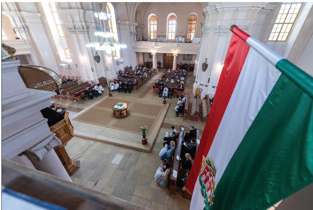
A kolozsvári alsóvárosi gyülekezet nemrég ünnepelte templomának 170. évfordulóját (A kép illusztráció)