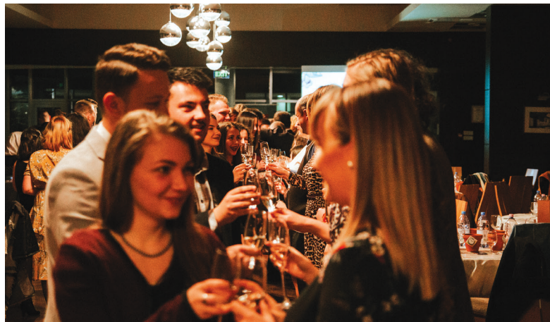
Koccintás a 2019-es IKE Önkéntes Gálán. Idén február végén ünnepelték az önkénteseket és az IKE 100. születésnapját

Egyre többször tevődik fel a kérdés, hogy léteznek-e még egyáltalán közösségek, illetve érdemes-e még ebben gondolkodni? Bár sokan azt jó-solták, hogy mára kihalt a közösségi tudat az emberekből, szerencsére csak részben lett igazuk – nem vészett el, csak átalakult. Az indíttatás azonban ugyanaz maradt, mint például az említett kalákában végzett munkák esetében: az emberek a szívük parancsára dolgoznak. A közösség megtartó ereje azonban nemcsak azoknak támasz, akikért dolgozunk, hanem min- ket is ugyanúgy tenyerén hordoz a gondviselés – talán itt a fizetség.