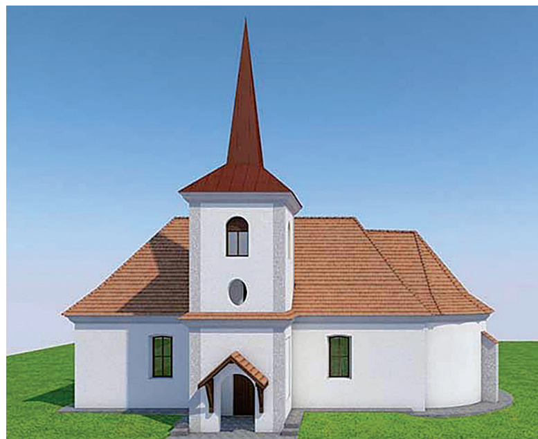
A csekelaki új templom látványterve

Közadakozásra kéri az erdélyi gyülekezeteket egyházkerületünk, hogy a 250 lelkes csekelaki gyülekezet felépíthesse új templomát. A körlevél tájékoztatása szerint a csekelaki egyházközség megpályázta régi templomának felújítását, tavaly tavasszal az egyházközség presbitériuma, majd közgyűlése kimondta, a magyar kormánytól templomfelújítási támogatásként kapott összeget az épület veszélyesen leromlott állapota miatt nem annak javítására, hanem – kinézete és méretei szerint a régivel megegyező – új templom építésére használná fel. Ehhez a gyülekezet megkapta az egyházkerület és a román állam jóváhagyását, de az időközben elszabadult árak miatt az eredetileg megítélt támogatás a templomépítés költségeinek alig a töredékét fedezi. Ennek ellenére az egyházközség presbitériuma elhatározta, hogy idén pályázatokból és adományokból összegyűjti a templom pirosba való felépítéséhez szükséges 270 ezer euró-