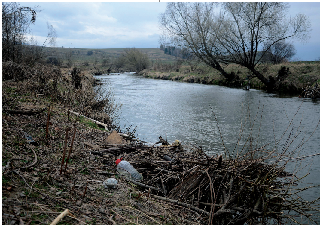
A folyók környékére sok szemetet szoktak hordani. Csak rajtunk múlik, hogy mennyire tartjuk tisztán

– Igen, mindenképpen az emberek egészségére is hatással van, mert a folyók alsóbb szakaszain is akarnak ivóvizet előállítani, és léteznek olyan vegyületek, amelyeket klórozással vagy szűréssel nem feltétlenül lehet eltávolítani. Ilyen esetben különböző toxinok oldva maradhatnak a vízben, s bár ezek gyakran nem változtatják meg a víz színét, ízét vagy szagát, így mégis olyan vizet ihatunk a csapból, amely mérgezést okozhat. A szennyezés véleményem szerint mindig visszaüt ránk, úgyhogy érdemes odafigyelni.