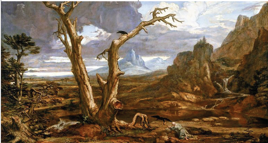
Illés a sivatagban. Allston Washington egyesült államokbeli festőművész alkotása a 18. századból