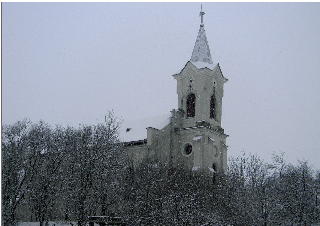
A kalotaszegi Középlak református temploma