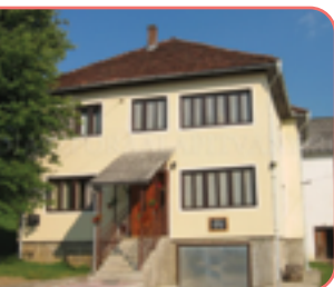
MAGYARLÁPOS Református Parókia 435600 Târgu Lăpuș Str. Florilor nr. 2 0262 384 345