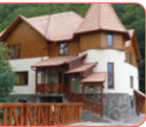
PARAJD Urbán Andor Református Központ 537240 Praid Str. Zsögöd nr. 553 0730 190 067 uarkkparajd@gmail.com