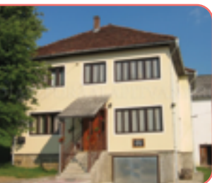
MAGYARLĂPOS Református Parókia 435600 Târgu Lăpuș Str. Florilor nr. 2 0262 384 345