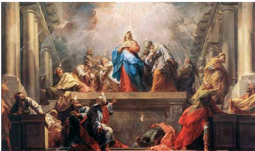
Pünkösöd. Jean II Restout olajfestménye (1732)

Az ígérek felelőssé tesznek bennünket, hiszen Isten Krisztusban örökséget adott nekünk. Felelősségünk nemcsak a saját életünkre szól, hanem mindazokéra, akik mellettünk