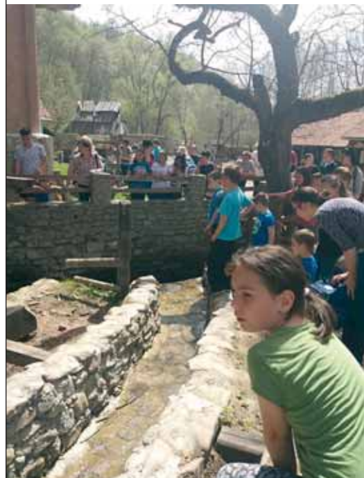
A vízimalom előtt a skanzenben. A kálnokiak a felsőcsernátoni malomkertbe is ellátogattak

vettünk részt. Ellátogattunk az alsócsernátoni Haszmann Pál néprajzi múzeumkertbe, az Ika várához és a felsőcsernátoni Malomkert hagyományőrző turisztikai központba.