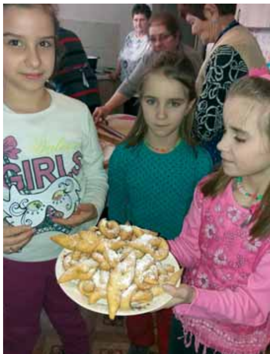
Elkészült a csöröge. A gyerekek nagy örömmel segítettek a sütemények elkészítésében

A benti tevékenységeket a helyi gyülekezeti termekben tartottuk, közösen hívogattuk a két egyházközség tagjait, de természetesen a helyi egyesület is sokat segített a lebonyolításban. A pályázat megírásakor alkalmanként legalább 25 résztvevővel számoltunk, azonban örömmel