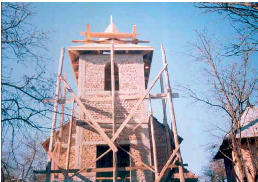
A Tordai Egyházmegyéhez tartozó Berkenyesen egy maroknyi ember fogott hozzá a templomépítéshez

A munka, a feladat sorozatos nehézségekbe ütközött. Nehémiásnak és a hozzá csatlakozóknak a temérdek feladat mellett gúnyolódókkal, sőt a felépített városfalat lerombolni akaró ellenséggel is szembe kellett nézniük. Az ellenséges indulatok miatt az építőknek feszült légkörben kellett dolgozniuk, ezért mindegyik építőnek a derekára volt kötve a kardja. | 3.