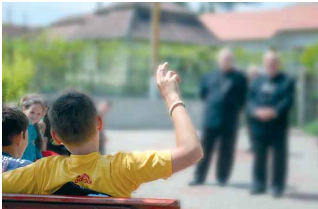
(a kép illusztráció)