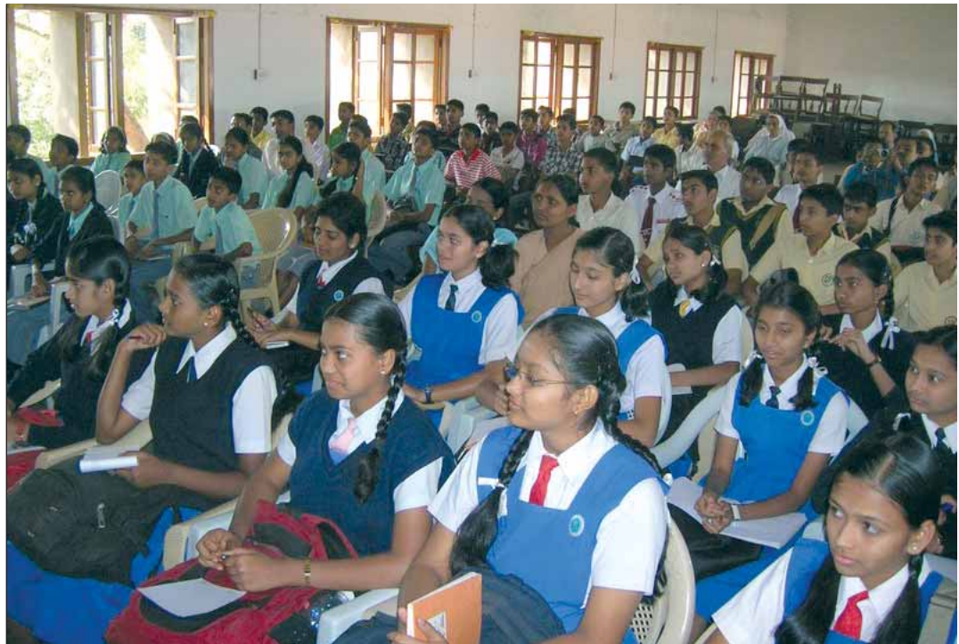
Keresztyén iskola Indiában. A szubkontinensen az iskolázottság nagyon alacsony

A zsidók a legmagasabban iskolázottak a világvallások követői sorában. Őket a keresztyének követik, majd a vallásilag el nem kötelezettek vagy a vallástalanok csoportja jön. A világvizonylatban felvett adatok tükrében a zsidóságban átlagban 13,4 évet töltenek el az emberek iskolázással. A keresztyének csoportjában 9,3 évet, a vallástalanok 8,8 évet, a buddhisták 7,9 évet, a muszlimok és a hinduk 5,6 évet. A vallási csoportok műveltségi szintje nagyon eltérő mértéket és minőséget mutat, ezért ez nehezen értékelhető. Megbízható mutatónak az oktatásban eltöltött idő minősül. A zsidóság iskolai „csúcsteljesítményének” a háttérben részben az áll, hogy a világ zsidóságának java része a gazdaságilag magasan fejlett két országban él: az USA-ban és Izraelben. A hinduk alacsony mutatója pedig részben azzal is összefügg, hogy a hinduk 98%-a fejletlen vagy fejlődő országban