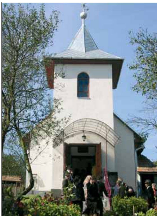
A kicsi gyülekezet adományoknak és sok közmunkának köszönhetően hamarosan birtokba vehette a hajlékot

Amikor a próféta tiszta képet kapott arról, hogy milyen teendők várnak rá, odaállt a nép elé, és buzdító beszédet tartott. Tudta, a terve szempontjából létfontosságú az, hogy rábeszélje őket az együttműködésre. Be akarta vonni, érdekeltté akarta tenni őket. Igyekezett felébreszteni a jeruzsálemi papokban és előkelőkben is azt a felelősségérzetet és lelkesedést, ami benne égett. Isten munkáisaiként nekünk is tudnunk kell, hogy vannak feladatok, amelyek csak ránk várnak, amelyeket egyedül kell elvégeznünk