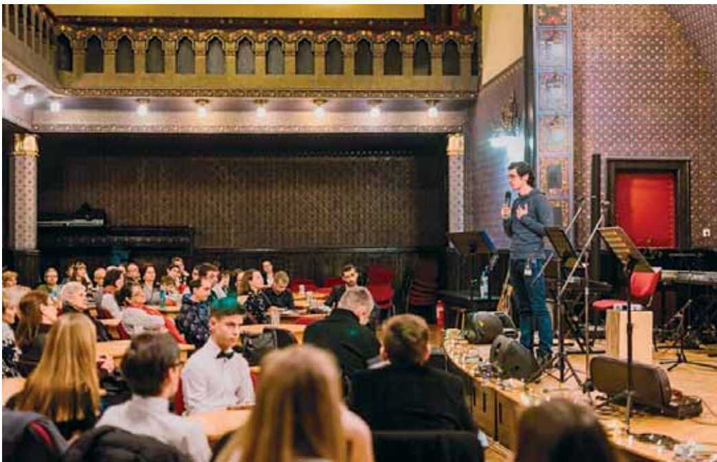
A szervezők a fiatalokat a szülőföldön való maradásra és az Erdélyben való boldogulásra biztatták