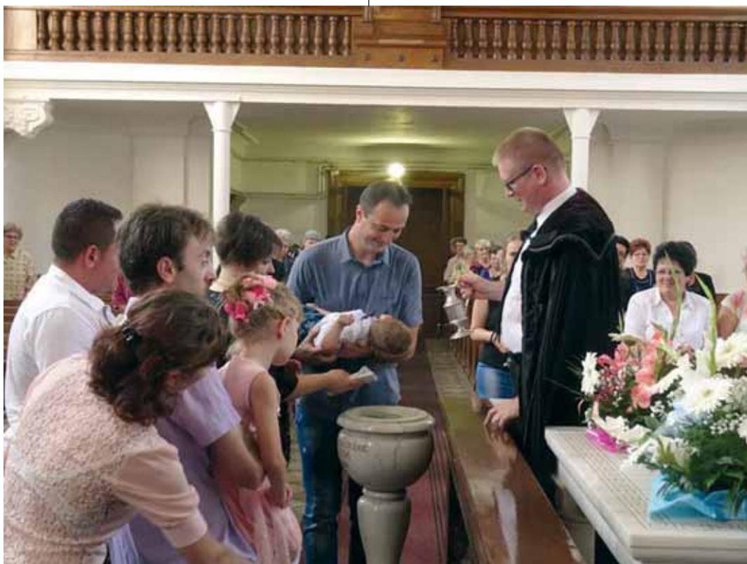
Keresztelő Bácsfeketehegyen. Bár a lélekszám apad, a település az egyik legerősebb református gyülekezet

Amúgy az egykori Bánság, Bácska nemcsak sok nemzetiség együttélésének volt példaképe valamikor, hanem számos vallási meggyőződés szabad gyakorlásának a békés helyszínének bizonyult. Sajnos nem sokáig. Mára a virágzó műltra utaló nyomok többnyire a történetírásban és a temetőkben maradtak tetten érhetőek. Valamikor kétszáz tagot számláló nazarénus gyülekezet és – a későbbiekben felújított – imaháza valamivel kisebb lélekszámú, ám zsinagógával rendelkező zsidó hitközség alkotott sajátos vallási színterületet Bácsfeketehegyen a már említett magyar és német reformátusokon, evangélikusokon, római katolikusokon, pravoszlávokon kívül. A falu zsidósága eltűnt, a zsinagógát 1948-ban lebontották, az ősök álmára ledőlt síroszlopok, bokrok és cserjék vigyáznak valahol a domboldalon. Alakult viszont Keresztyén Adventista Egyház és Teljes Evangéliumi Gyülekezet. Létezésüket és működésüket két nyelvű szerb–magyar feliratok igazolják a Tito marsall és a Nikola Durkovic utcában.