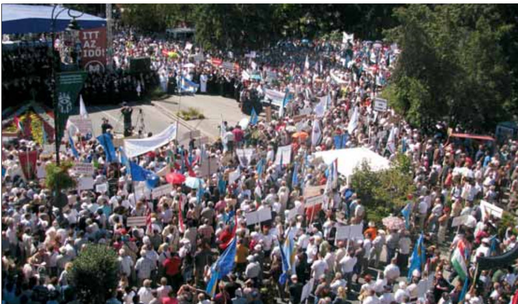
Tüntetés a Mikóért. Sepsiszentgyörgy központjában több ezren emelték fel szavukat az igazságtalanság ellen

Lehet, hiba bennünk is van: nem mindig elég a legjobb ügyvédek és a legmegcáfolhatatlanabb bizonyítékokat felsorakoztatni. Szükség van a sok imádságra, az egységre és az összefogásra is. Emlékszem, annak idején, amikor a Mikóért szervezett tüntetésre érkez-