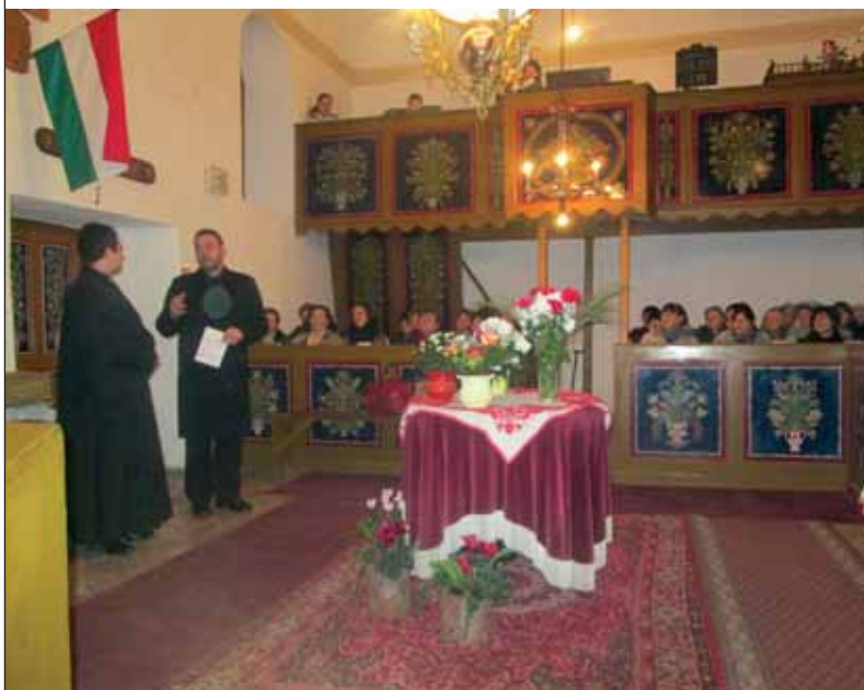
Templombelső a lámpával, amelyiknek a gömbjében van az üzenet

„Legyenek egygyé a kezekben.” (Ez 37,17). E prófétai gondolat vallástól függetlenül magyar fogadalom is. Mi, magyarok, bárki próbál minket szétszórni, egymás ellen fordítani, összetartozunk. Üzenet – főként mostanság – a káoszba süppedt, hitehagyott Európának, üzenet a jövőnek. Voltunk, vagyunk és leszünk is, amíg a világ létezni fog. E kihívások teljesítéséhez elsősorban hinni kell önmagunkban, hogy hinni tudjunk Istenben. Az irány: ráébreszteni a világot arra, hogy mi történik velünk, és ráébreszteni a magyarokat arra, hogy nekünk kötelelességeink vannak. Éppen ezért dolgozunk templomunk megújulásáért, egyházunk megmaradásáért. Együtt küzdünk vallási hagyományaink megőrzéséért, a falu közösségéért. Áld vagy ver a sors keze, de keresztyén nemzeti értékeinknek tovább kell élniük. Csak a víz szalad, de a kő mindig itt marad. A kövek mi vagyunk, és mi leszünk a közösség aktív tagjai, akik dolgozunk a megmaradásért, és akiknek köszönet jár a munkáért. 8.