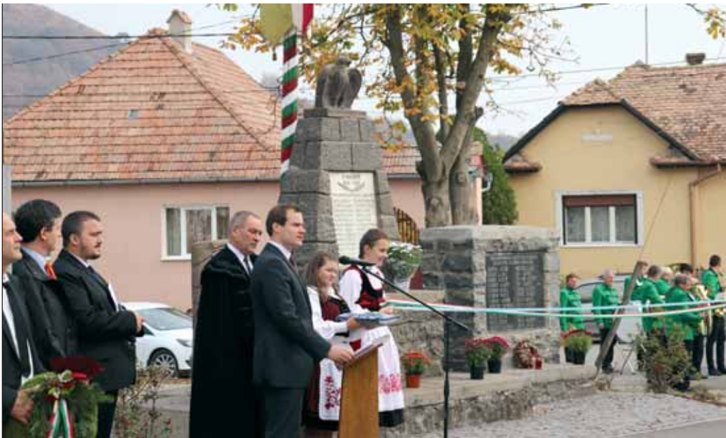
A kisgalambfalvi szoborcsoport méltóságteljesen fogja őrizni a rajta szereplő személyek emlékét

A felújítás a magyar kormány által indított első világháborús emlékművek rendbetételét célzó pályázati program révén jöhetett létre.