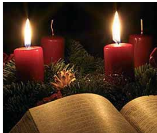
A meghitt adventi készülődés egyre ritkább

Sokan nem engedhetik meg maguknak, hogy év közben vásárolgassanak, de karácsony közeledtével még ők is megtörnek, pedig vásárlás helyett másképp is kifejezhetnék szeretetüket. A reklámszakember is úgy véli: az advent csendjéhez, valódi tartalomhoz sokkal jobban illik az alkotás, semmint a vásárlás, ezt viszont nem lehet másképp elmondani a világnak, csak példamutatással. Imre maga