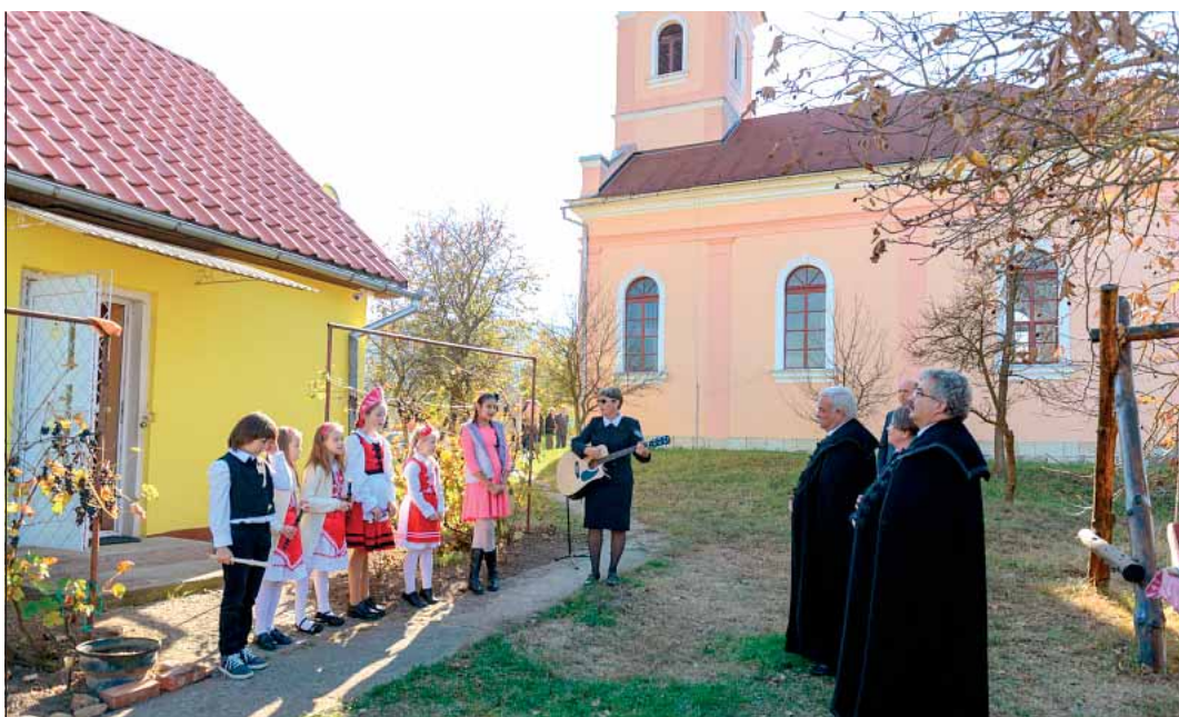
Nagy a templom, kicsi a gyülekezet. A hetven lelkes Sajószentandráson szórványközpontot avattak (8. oldal)

Visszaemlékszem gyermekkorom éveire, amikor szülőfalumban valaki tudni szeretett volna, ki vagyok, nem azt kérdezte, hogy hívnak, ki vagy, hanem kié vagy. Így korán tudatosodott bennem, hogy kilételem elsősorban hovatarozásom határozza meg: az, hogy milyen családba születtem, kik a szüleim, milyen vallású vagyok, és mi az anyanyelvem. | 2.