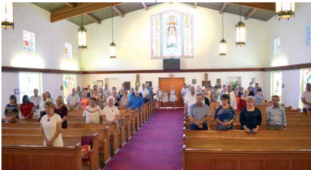
Református istentisztelet Miamiban. A város és környékének magyarsága kitart

Kegyelettel és szeretettel emlékezünk az egykor közöttünk alkotó, közösségi tevékenységeket folytató, a hívő élet példamutatásával minket is megvilágító elődeinkre: a magyar nemzet nagy emigráns írófejedelmére és Miami örökkévalóságba távozó lelkészeire egyaránt.