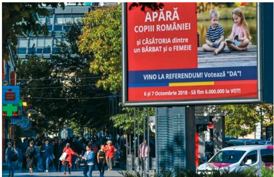
Gyenge kampány. Országszerte kevés plakát buzdított a népszavazáson való részvételle

Ha viszont jobban belegondolunk, nem kell csodálkozni azon, hogy a népszavazás eredménytelen lett. A románok egy része csak azt hallotta, hogy az egész felhajtás az ortodox egyház és a folyamatos korrupciós ügyekkel bajlódó Szociáldemokrata Párt közös akciója. Holott a kormányt a civil szervezetek által összegyűjtött mintegy hárommillió aláírás készítette arra, hogy kiírja a referendumot. Másokat az tántorított el a részvételtől, hogy a kérdés nem volt elég világosan megfogalmazva. Sőt a hagyományos családmódel megfogalmazás nem is szerepelt a kérdésben. Nem segített az ügyön