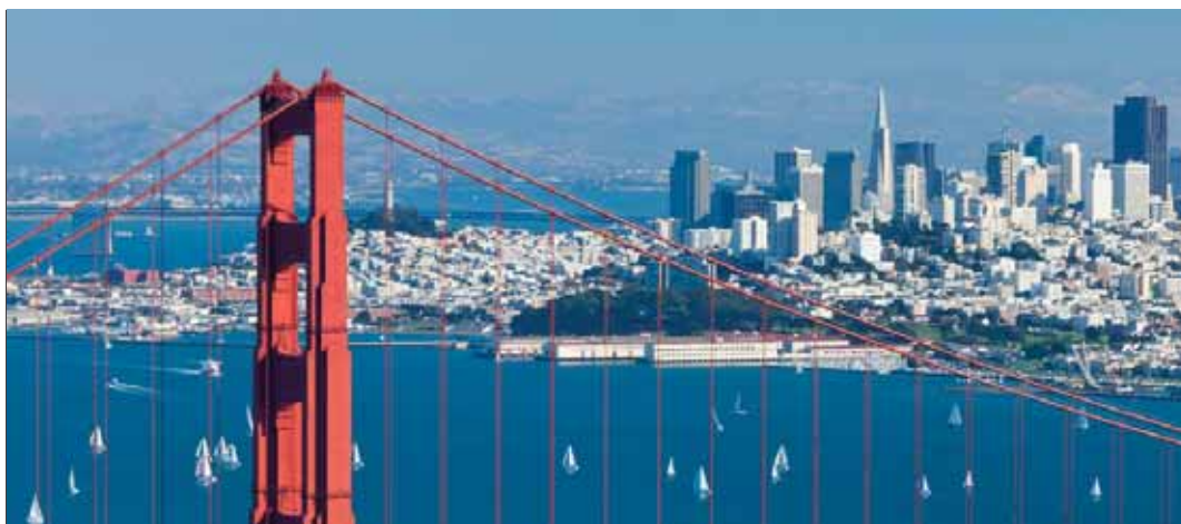
A Golden Gate, háttérben San Francisco. Jellegzetes kép Kalifornia egyik legjelentősebb városáról

A hónap első vasárnapján kétnyelvű az istentisztelet, hogy a magyarul nem tudó házastársak vagy éppenséggel a magyarsággal szimpatizálók is otthon érezzék magukat a gyülekezetben. Amúgy sok az erdélyi származású családból való egyháztag, és a 10 ezer kilométeres távolság ellenére lelkiükben hazagondolnak. Sőt évekkel ezelőtt egy harminc-