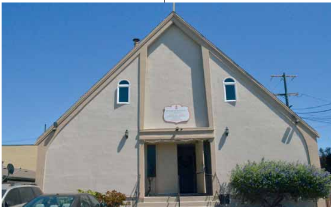
A város reformátusságának temploma: a környék magyarjai minden vasárnap istentiszteletre gyülekeznek

Úgy tűnik, San Francisco környékének református magyarsága él és élni akar, ennek jegyében pedig terveket sző. Egy olyan nagyobb központ megvalósításáról álmodik, amelyben a fiatalokkal való foglalkozás kibővíülhetne, ugyanakkor nemcsak a református egyház otthona lenne, hanem egyúttal magyar házként szolgálna. Az egykori ingatlan helyett, amelyet a 80-as évek elején eladtak, mivel nem tudták már fenntartani, részben amiatt, mert a környéke „leromlott”, olyan központot szeretne, amely a napjainkban működő tizenhét különböző magyar szervezet otthona lehetne. Isten áldja meg álmaikat, és erősítse akaratukat!