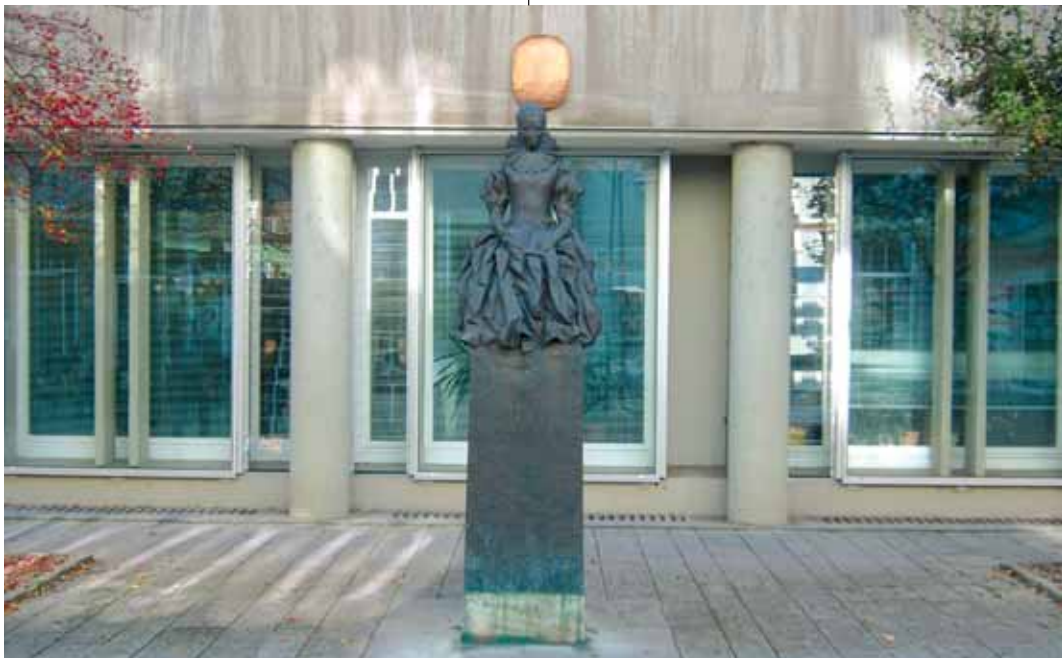
Fulvia Morata Olympia szobra a Majna partján fekvő Schweinfurtban

Ez a ragyogó tehetség nagy istenbizalommal élt. Levelezett német, svájci prédikátorokkal, Flacius Illyricusszal, Dalmácia és a horvátok reformátorával is. Ha tovább él, ő lett volna Németország első egyetemi professzor-nője Heidelbergben. Életét nem tudta könyvek nélkül elképzelni. Kora könyves és bibliás Olympiája, protestáns Minervája volt. Feleség, de nem anya – gyermekei a versei voltak. Levelezéséből kitűnik, többen a legédesebb tanárnőnek, drága Kerubimnak, angyalnak nevezték. Nem véletlenül: evangéliumi hite, érzékeny, költői lelkülete, művészi érzéke és férfiakat csodálatra készítő műveltsége földön járó, mégis légiessé formálták őt a viharos 16. század béke-szigetén, a református Heidelbergben. Ennyit legalább nekünk is illik tudni róla. Nehézségek, összeomlások között Istenben bízó hite szép imádságát vessük a szívünkbe: „Uram, ha azt akarod, hogy éljek, végy engem angyalaid védő szárnyaira, s ők emeljenek fel, mert nem bírom tovább. Ámen.”