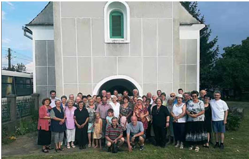
Csoportkép az egyházkerület presbiterszövetsége által szervezett tizedik nyári konferencián

Mindezért hálát adok Istennek, hogy erőt és egészséget adott meglátogatni e tájakat. Az