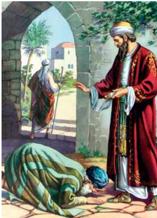
A szolga megtanulja a legfontosabbat: szívből könyörögni

Ez volt a baja e példázatbeli szolgának is: úgy bánt ura javaival, mintha minden a saját-