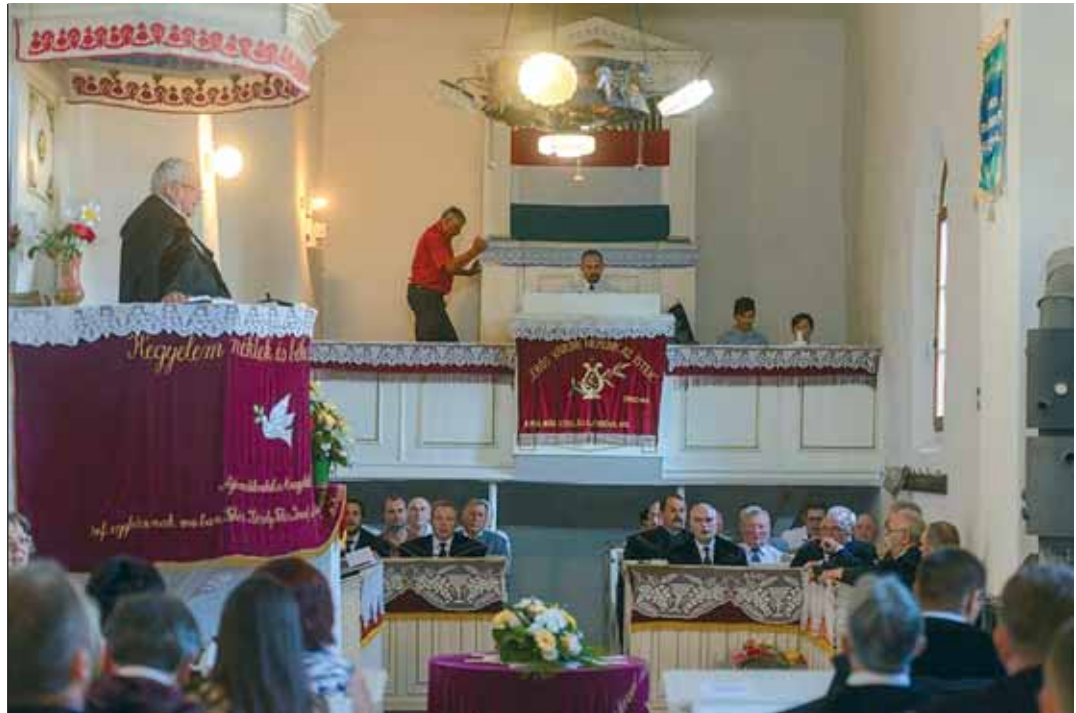
Kató Béla püspök az egyházkerületi vizitáció alkalmával igét hirdet a marosnagylaki református templomban

– Igen, teljes mértékben. Nem akarom azt mondani, hogy a női lelkipásztorok szolgálata minőségben jobb, mint a férfiaké, de biztos, hogy nem rosszabb. Ennek oka az, hogy a lányok a teológiára eddig alig néhány helyre felvételiztek, ezért a tudás és értelmi képesség alapján csak a