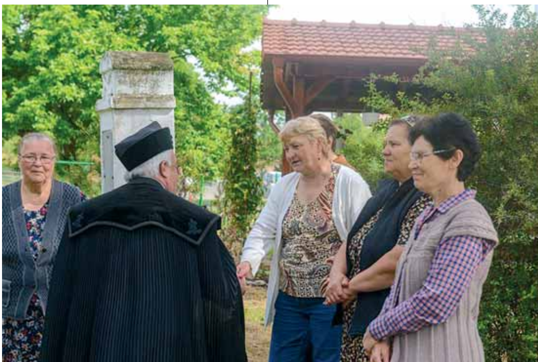
Az egyházkerületi vizitációs bizottság idén a mezőmehesi gyülekezetet is meglátogatta

– Úgy láttuk, hogy a képzés időtartama hosszú. A hatéves képzés utolsó évét gyakorlati képzéssel egészítettük ki. Tehát a hatodéves diákok egy lelkipásztor mellett beosztottként egy éven keresztül gyakorlatban sajátítják el a lelkipásztori teendőket, közben pedig a teológián tanulnak. A tapasztalatok azt mutatják, hogy az új rendszer – amelyet nyilván folyamatosan jobbítani lehet – bevált, a teológusok a legációk során magabiztosabbak, felkészültebbek voltak. Hatodév végén a kispapi vizsgát teszik le, ezt követően segédlelkészként szolgálnak egy évet, amelynek végén a nagypapi vizsgára kerül sor. Ennek során a korábbiakkal ellentétben nem elsősorban a lexikális tudás visszakérdezésére helyezük a hangsúlyt, hanem az alkalmasságot vizsgáljuk, és természetesen figyelembe vesszük azoknak a lelkipásztoroknak a véleményét is, akik mellett a fiatalok egy évig szolgáltak.