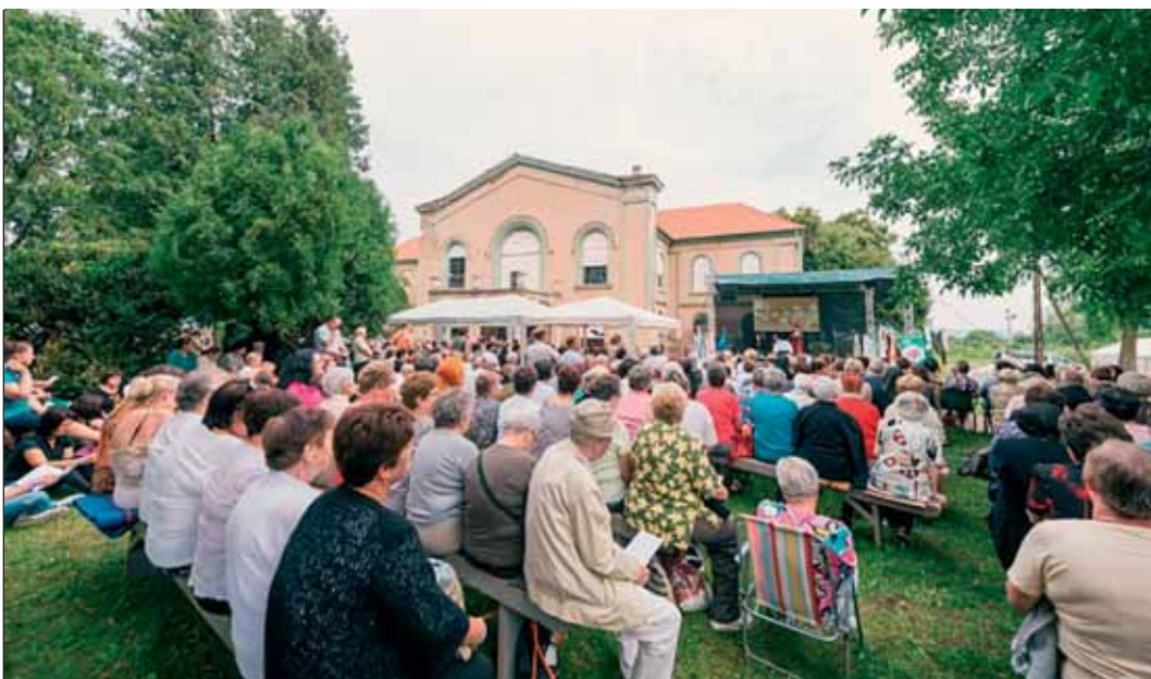
Megújulás előtt. A Bethlenek bonyhai ingatlana az erdélyi kastélyhagyaték egyik reprezentatív épülete