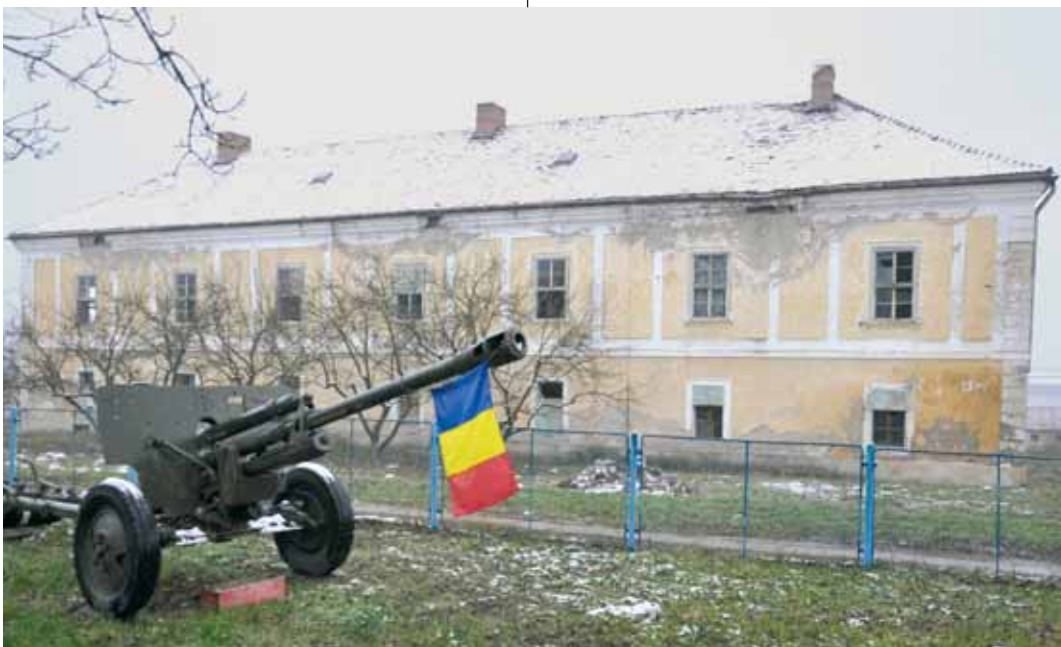
Az egyik ágyú mintha a mezőörményesi kastélyt is védené. Vagy perlekedne vele?

Vannak emberek, akik még mesélnek a közelmúltól és a jelenről, amely lassan történelemmé válik egy-két emberöltő múlva. A magaslatokra épült templomok őrzik még a falak közé zárt szavakat, a magyarul elmondott zoltárokat, ígéket. Aztán maradnak a kövek, amelyek kavicsá porladnak, és egyszer majd homokként szétszóródnak a szélben.