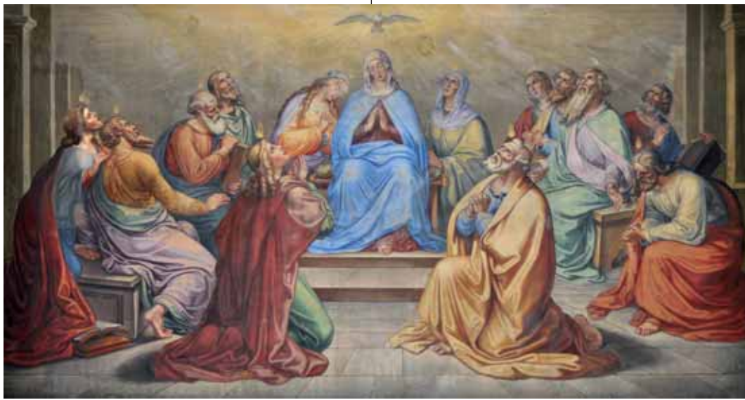
Fidelis Schabet német festőművész alkotása Pünkösdről

Evangéliumra éhező közösség vagyunk. Apadó, de egymással szemben lobogó nemzet-részként kimondva kimondatlanul vágyunk a reánk köszöntő ünnepek, a belénk költöző ige után. Amikor a reá figyelő lélek elcsendesedhet, és élete nehéz tartalmára az Úr válaszát engedheti közel magához. Mert fájdalmasan sok romboló emberi beszéd lakozik a lelkünkben, amely megbetegít, pusztít. Éppen ezért az egymástól elválasztó mikrovilágunk jelenében kellene