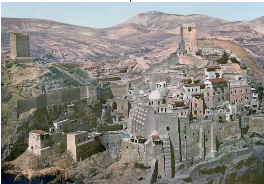
A palesztinai Mar Saba-kolostor. Látkép a 19. század végéről

„A Lélek Krisztusnak nem másolata, sem hasonmása, hanem eredeti személy. A Szentlélekről Krisztus-központúan szabad csak szólni, amint Krisztusról csak Lélek-centrikusan” – olvashatjuk Berkhof felismerését. Ő az első között van, aki már az 50-es években folyamatosan emlékeztetett arra, hogy a teológiai gondolkodásnak a Szentlélek munkálkodását a teremtett világban sokkal elmélyültebben kellene kutatni és tudatosítani. Nemezszer emlékeztetett Kálvinra, aki szerint a Szentlélek a teremtett világban „rejtett erőként” van jelen és munkálkodik. Az így működő Lélek segítségével kormányozza a világot és a csillagokat, valamint az emberi szíveket.