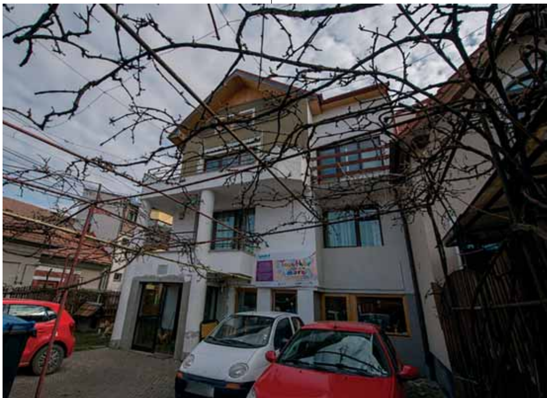
A Diakónia Keresztyén Alapítvány kolozsvári, Zambilei utcai székháza

Aki az adója két százalékát a diakónia kolozsvári fiókjának szeretné felajánlani, nyomtatványt kell kitöltenie, és személyesen nyújthatja be az adóhivatalnál, vagy eljuttathatja az alapítvány valamely munkatársához, illetve a szervezet székhelyére Kolozsváron a Zambilei utca 7. szám alá május 25-ig.