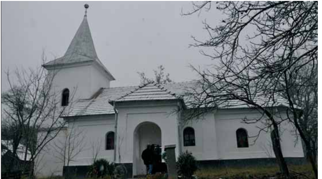
A komlói református templomba egyre kevesebben térnek be Isten igéjét hallgatni