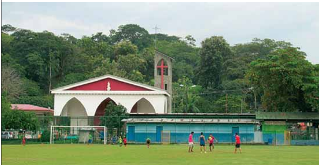
Egymás mellett. Templom és labdarúgópálya a Costa Rica-i Queposban

Nem tudom, mi állhatott a döntés hátterében. Elképzelhető, hogy a muzulmán vallás rendkívül szigorú szabályait következetesen