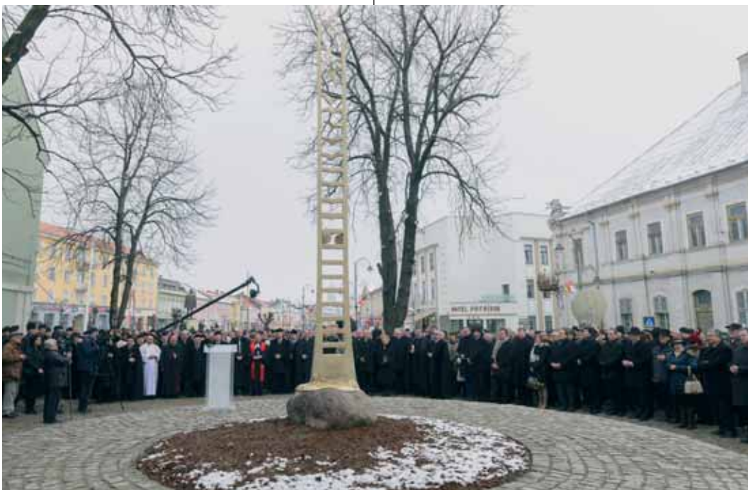
A vallásszabadságot szimbolizáló Tordán felavatott emlékmű Liviu Mocan kolozsvári szobrász alkotása

Az ünnepséget követően az érdeklődők megtekinthették Körösfői-Kriesch Aladár A vallásszabadság kihirdetése az 1568. évi tordai országgyűlésen című festményét a tordai városi múzeumban.