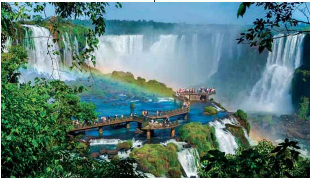
Az Argentína és Brazília határán fekvő Iguazú-vízesést turisták százezrei keresik fel minden évben

A világot összefogó imádság mérhetetlen nagy, hegyeket is megmozdító erejéről tett újra bizonyosságot e csodálatos hét minden napja. Hálatelt szívvel köszönöm meg Istennek, valamint a Romániai Keresztyén Nők Ökumenikus Fóruma vezetőségének, hogy méltónak talált arra, hogy a romániai imanapot ilyen áldásokban gazdag konferencián képviseljem.