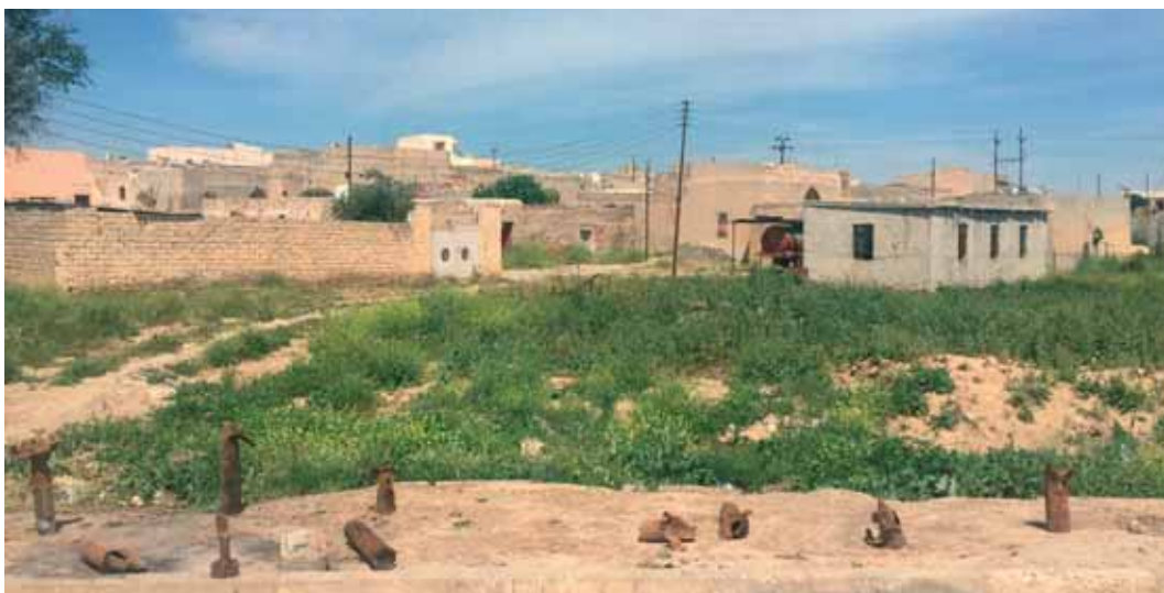
Az Iszlám Állam által hosszú ideig terrorizált falu egy kihalt település képét mutatja

A CSI folyamatosan figyeli az eseményeket, és próbál ott segíteni, ahol a legnagyobb szükség van. A visszatérő családok majdnem három évet töltöttek el menekülteként az otthonuktól távol. Most üres kézzel teljesen új életet kell kezdeniük: mindenüket elvesztették, házaikat pedig lerombolták.