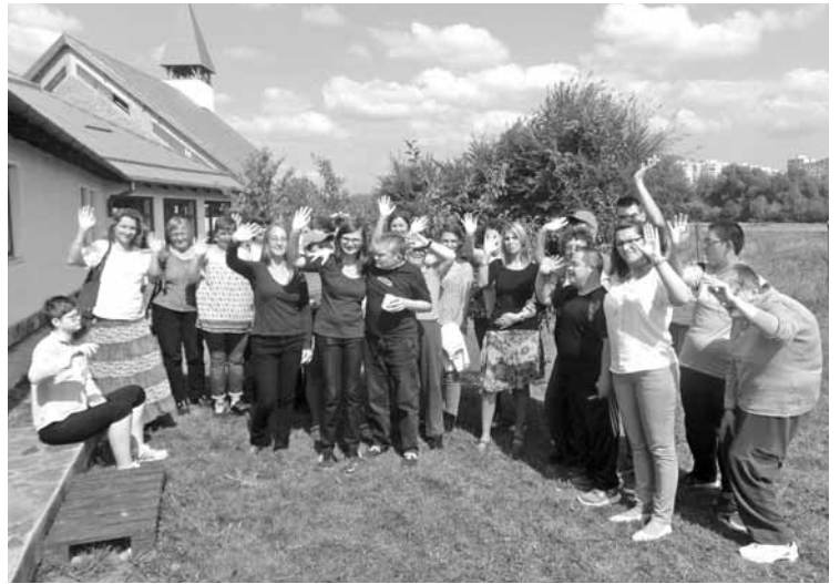
Az evangéliumnak mindenki szívéhez el kell jutnia

Kedves olvasó, ha látod, hogy a lelkipásztorod fáradozik, menj és segíts neki, mert egy közösség akkor lesz élő, ha a tagok is élők. Rád is