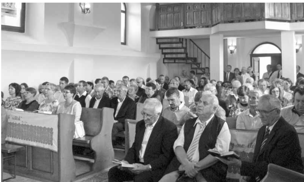
Az igehirdetés során elhangzott: ha hiszünk, van reménység