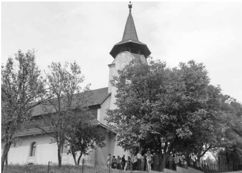
A felújított templom a kéri közösség élni akarását bizonyítja

A gyülekezetben nincs sok fiatal, a kicsik Szamosújvárra járnak be iskolába, pár éve konfirmáltak is néhányan. Szerencsére az apadás nem olyan nagyméretű, mint máshol: az elmúlt kilenc évben a lelkipásztor hármat keresztelelt és négyet temetett.