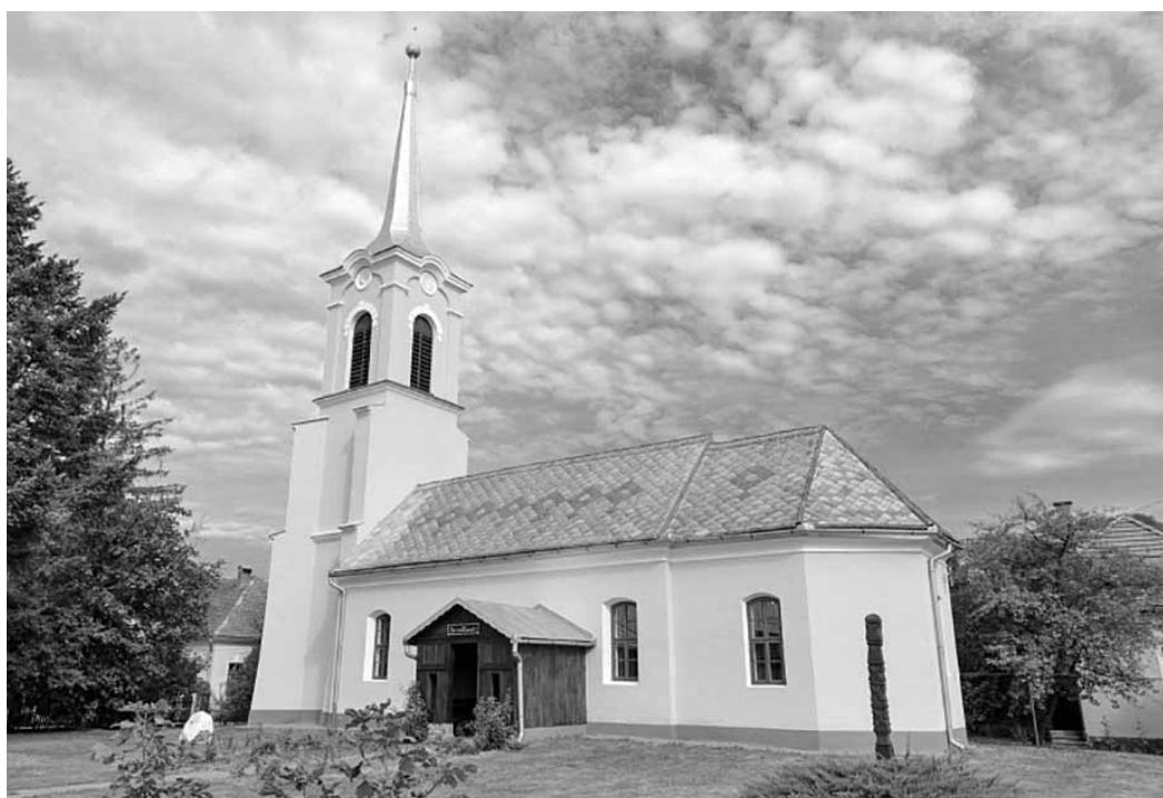
A templomfelújítással a görögnyelvi templomunk biznyságot tettek hitükről