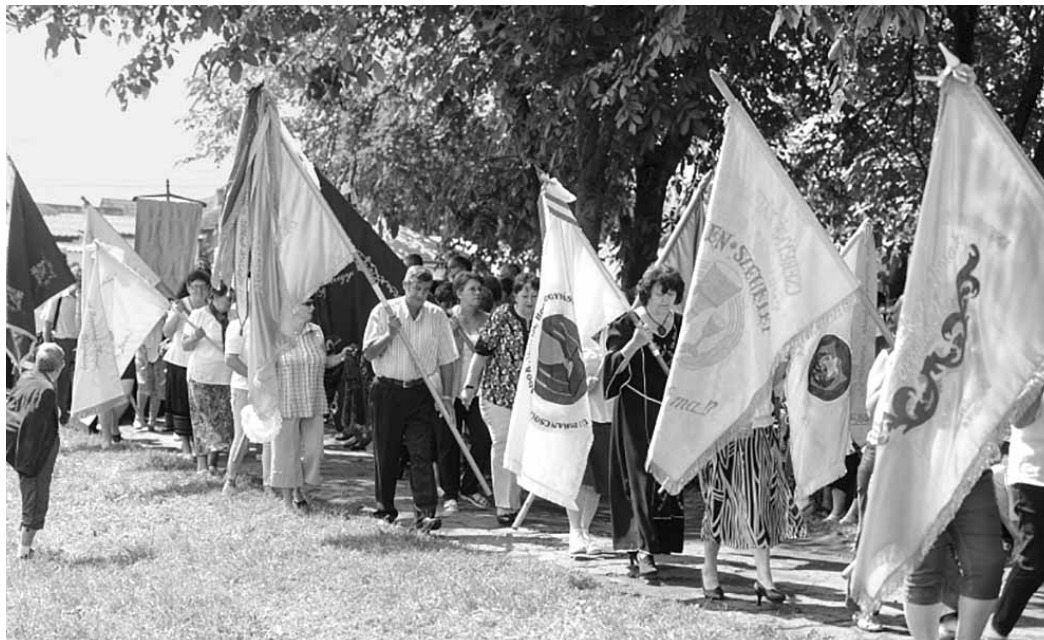
A szervezők célja a testvérnőszövetségek megerősítése és az asszonyok közötti kapcsolat ápolása

Biró István küküllői esperes a találkozások napjának nevezte a családcentrikus rendez-