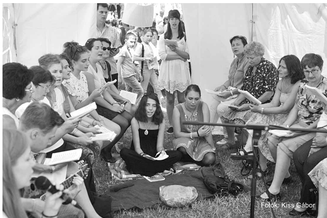
Zsoltáreklés árnyékban. Az egyik leglátogatottabb idén is a dalossátor volt