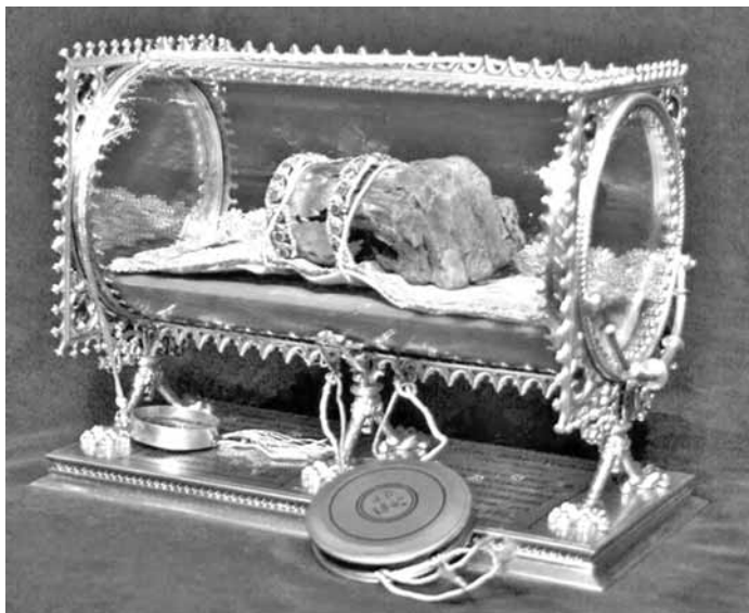
A Szent Jobb ezüstből és csiszolt üvegből készített ereklyetartóban, amelyet Lippert József primási főépítész tervei alapján 1862-ben Bécsben készítettek

„Tudod, királyom, olyan vidék ez, amelyen mindig átvonul az ellen. Mi még védve vagyunk e kicsi szigetecskén, de innen le egész Biharig és még tovább délre, nincs ki megállítsa az ellenséges támadást. Sokat könyörögtem drága Máriánkhoz, segítse meg népünket a baj-