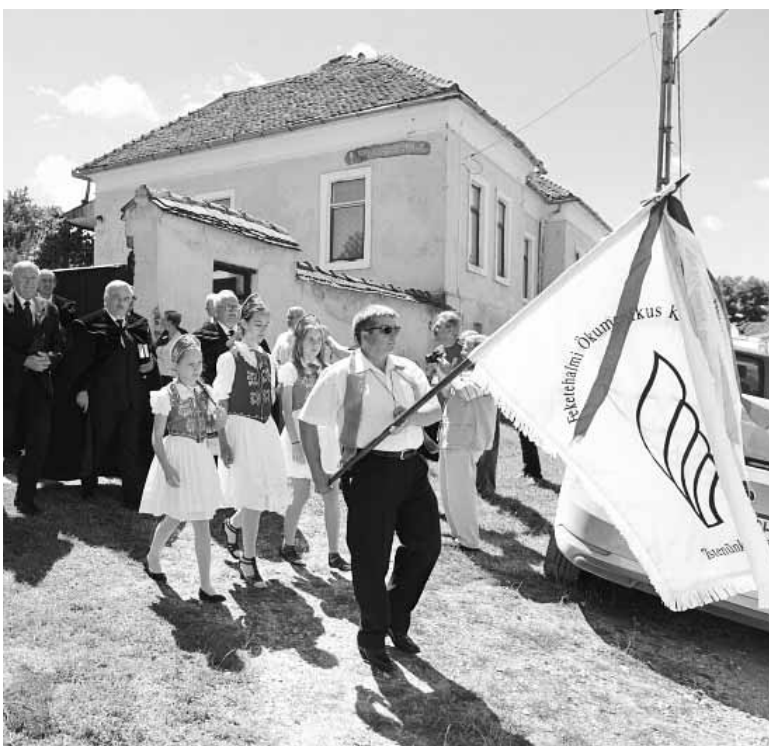
A Brassói Egyházmegye szóránygyülekezetei Kóborban gyűltek össze, hogy közösen adjanak hálát az elmúlt 500 évért (Írásunk a 4. oldalon)

Szóránygyülekezetek találkozója Kóborban