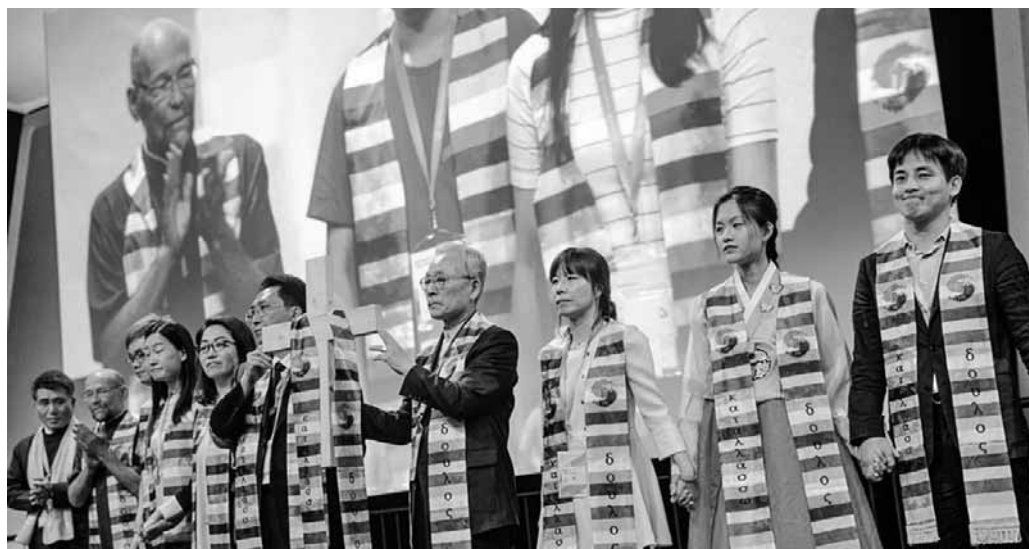
Koreai protestánsok. A református világközösség az ázsiai országban élő keresztyéneket is támogatja