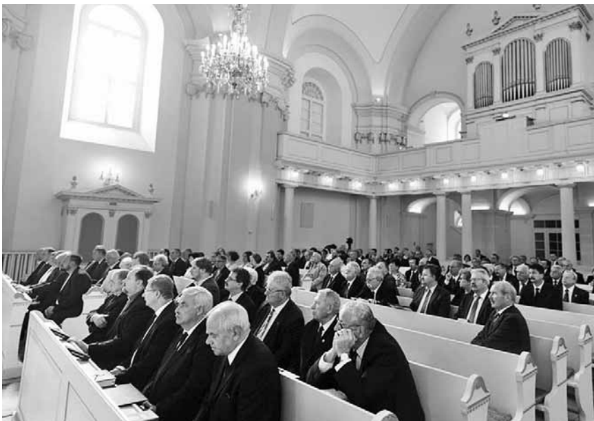
Ünnepi istentiszteleten a kolozsvári evangélikus–lutheránus templomban

A reformációt ünneplő zsinat tagjai meghallgatták a teológia vegyeskarának műsorát, majd a külföldi meghívottak köszöntői következtek. Semjén Zsolt miniszterelnök-helyettes üzenetben köszöntötte a zsinatot. „Ünnepük legfőbb üzenete, hogy reményt ad a keresz-