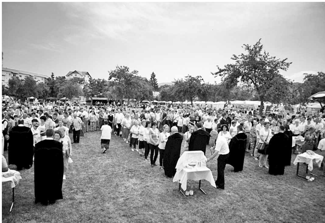
A gyülekezeti napon úrvacsoraosztás után a templomkertben leleplezték Kálvin János mellszobrát

Isten arra int, hogy folyamatosan vizsgáljuk újra életünket, családjunkat, közösségünket. A nép